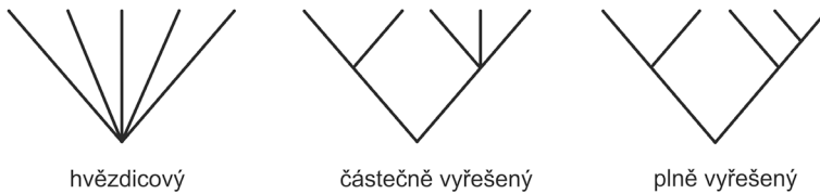
Obr. 1.2 Ukázka tří stromů s různou mírou objasnění jednotlivých větví.

předka (např. sekvence genu pro podjednotku alfa hemoglobinu u druhů a a B). Ortologní sekvence mohou být někdy nechtěně zaměněny za sekvence paralogní . Tak se označují sekvence genů, které vznikly genovou duplikací (Ohno 1970), například sekvence genů pro podjednotku alfa a beta hemoglobinu (obr. 1.3). Jinými slovy, zatímco ortologní sekvence divergují po speciální události (tj. po vzniku nových druhů), paralogní sekvence divergují po události duplikační. Paralogní geny vzniklé duplikací celého genomu se někdy označují jako ohnologní (Wolfe 2000.) Podobné, byť ne tak časté riziko představují sekvence xenologní , které byly do zkoumaného genomu vneseny z jiného organismu. Určitou variací paralogních a xenologních sekvencí jsou pseudogeny přenesené do jaderného genomu z mitochondriální DNA (anglicky se zpravidla označují zkratkou numt z nuclear mitochondrial sequence ). Tyto pseudogeny mohou být i velmi velké, například u některých kočkovitých šelem dosahuje jejich velikost přibližně 12,5 kb (Kim et al. 2006) a obsahuje tudíž převážnou část mitochondriálního genomu. S rostoucím množstvím molekulárních dat se ukazuje, že „numity“ mohou být značně rozšířené (viz www.pseudogene.net ) a nebezpečí jejich záměny s mitochondriálními sekvencemi je tedy potenciálně velké.