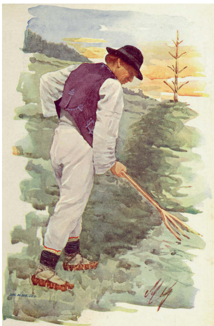
Marie Gardavská: Muž z Rusavy, zač. 20. stol. Pohlednice.