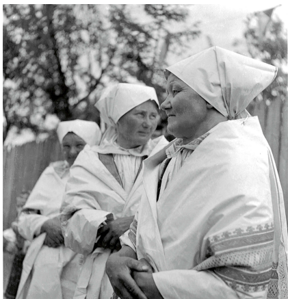
Úvodnice z Velké nad Veličkou. ÚEE A01068.