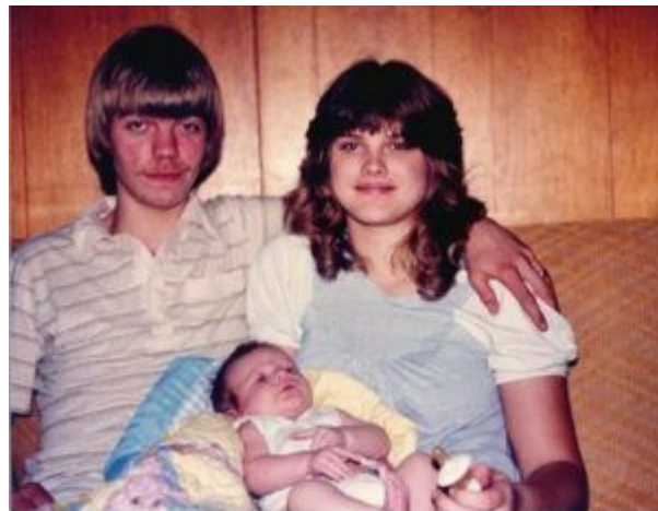
S prvním manželem a svým synem

a nelezla opilá do auta, jak měla v úmyslu. Ovšem pro dívku to bylo velké ponížení ... utekla z domova.