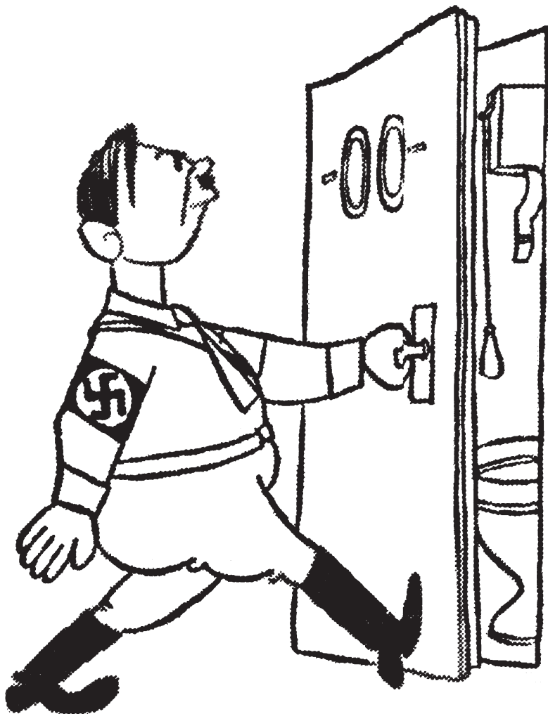
Triumf totalisace – jediná strana, která je v Německu dovolena (Ondřej Sekora, Lidové noviny, 30. 6. 1933)