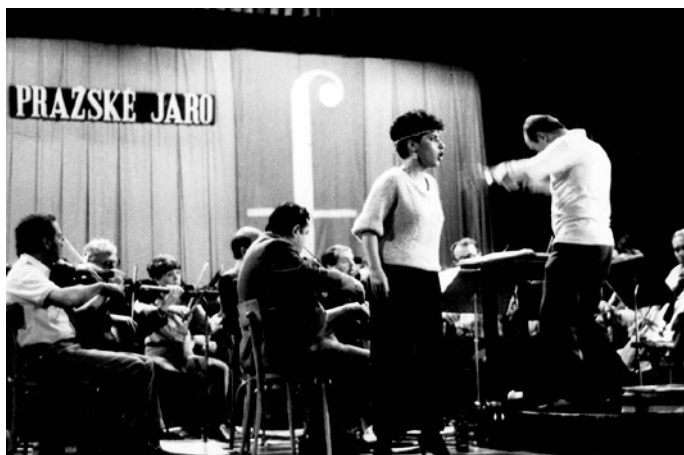
Vítězka pěvecké soutěže Pražského jara 1986.