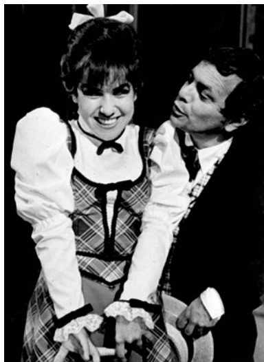
Hello, Dolly (Hudební divadlo Karlín, 1982) v roli Minnie.