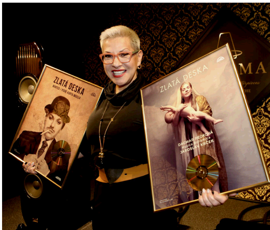
Rovnou dvě Zlaté desky Supraphonu převzala v roce 2019, za Wanted a Nativitas.

moc nevážil. To turné končilo ve Vídni a Klaus mi tehdy při loučení sliboval, že za mnou přijede. Já si říkala, že jen tak kecá, ale on pak opravdu přijel. Byl to přitom první chlap v mém životě, kterého jsem nepřemlouvala, aby se mnou zůstal. No, a v červenci 2000 jsme se vzali.“