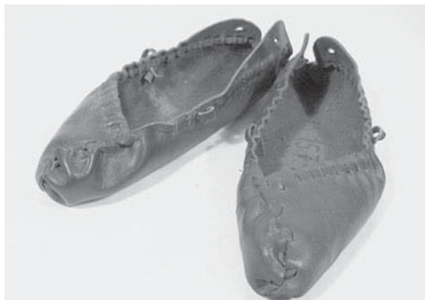
■ obrázek 4 Krpce s otevřenou patou a asymetrickým „nosem“ z Lopeníku na Moravských Kopicích. Foto archiv muzea J. A. Komenského v Uherském Brodě.

Lýtká si u nižších typů obuvi lidé chránili hustým omotáním řemínků kolem nohy. Dá se říci, že tento způsob ochrany byl předchůdcem punčoch z vlněného materiálu, které jsou doloženy již od 12. století a pravděpodobně se na ně také vztahuje ruský výraz kopytce , známý od 11. století. Na Moravě a v Polsku se dosud používá pro vlněné ponožky, které se obouvají do krpců.