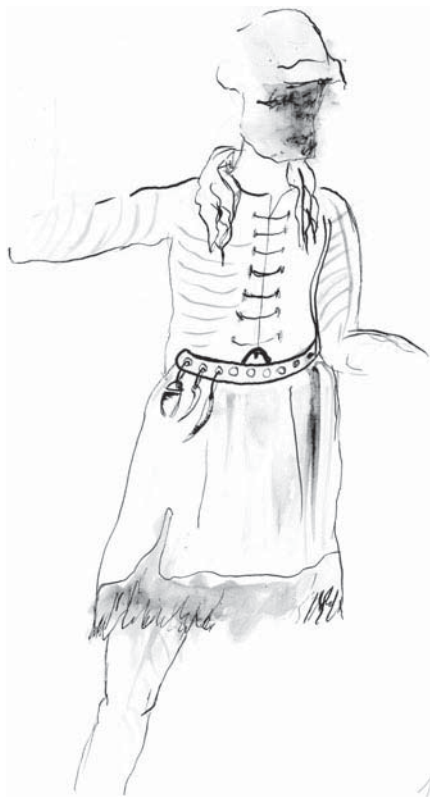
■ obrázek 1 Použití opasku u starých Slovanů. Podle L. Niederleho.

Z evropských oblastí za římskou hranicí, které tehdy obývaly tzv. barbarské národy, se nedochovaly žádné hmotné doklady ani zprávy o zpracování kůží, ačkoli tyto technologie museli obyvatelé barbarských území ovládat, protože zprávy Římanů o nich uvádějí, že se oblékali do chlupatých kůží divoké i krotké zvěře. Lidé v kulturně rozvinutých středomořských státech, kteří již dávno zhotovovali oděvy z tkaných látek, považovali takový způsob odívání za necivilizovaný. Lze předpokládat, že chladnější středoevropské klima nutilo obyvatele i nadále si zhotovovat oděv z kůže a kožešin, přestože i oni posléze poznali konopné, lněné nebo vlněné tkané látky.