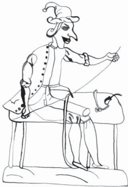
■ obrázek 6 Švec. Podle publikace Miroslava Janotky a Karla Linhartá.

výdaje pak padly na pohoštění cechmistrů, kteří mistrovské kusy posuzovali, a na zaplacení „příjemného“, což představovalo nemalou položku. Pro většinou chudé tovaryše bez patřičných prostředků zbyla vlastně jediná možnost, jak se stát sám sobě pánem – mohli si vzít mistrovi dceru nebo vdovu po něm.