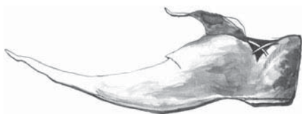
■ obrázek 5 Středověký typ zobcovité obuvi.

Středověk sice přinesl nové tvary a vzhled obuvi, ale v technologii výroby žádná větší změna nenastala. Tak, jako se v této době obecně zanedbávala péče o tělo a hygiena, nebral se zřetel ani na anatomii a funkčnost obouvání. Tvar obuvi nabývá velmi roztočivých, až bizarních podob. V době křížáckých výprav, ve 12. – 13. století, se v Evropě začíná projevovat vliv Orientu, který vrcholí v přehnaně špičatých tzv. zobákovitých střevicích , charakteristických především pro gotické období. Ve Francii dostaly pojmenování poulaine a prosadily se všude, kde vládla burgundská móda. Byly pestré jako tehdejší oblečení a jejich špičky měřily někdy až dvakrát více než sama podrážka; aby se v nich vůbec dalo chodit, musely se špičky přivazovat řetízky pod kolena. Zobce byly často zdobeny rolničkami. V takové obuvi byla chůze téměř akrobacií, a její majitelé se také pěšky pohybovali co nejméně – jezdili na koních a v kočárech. U nás se tato móda rozšířila hlavně ve 14. – 15. století. V této době se vyrábí obuv symetrická, na obě nohy stejná, je rovná, bez podpatků.