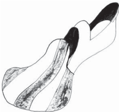
■ obrázek 7 Renesanční obuv – tzv. kraví huby.

Po roce 1450 se špičky zobákovitých bot začaly zkracovat a móda se vrhla zase do opačného extrému. Obuv byla hodně široká, plochá, hluboce střižená, špičky krátké, svršek zakulacený. Tomuto typu bot se pro jejich vzhled začalo říkat kachní zobáky , volské tlamy či medvědí tlapy . Zhotovovaly se ze žluté nebo černé kůže, ale i z jemné barevné kůže, z hedvábu či sametu. Byly charakteristické pro dobu reformace. Později přišla do módy majetných vrstev obuv bez špiček – a prsty na nohou se zdobily prsteny. V 14. – 16. století se ujaly „dřevěné přezůvky“ – návleky, které se obouvaly hlavně přes zobákovité boty. Jejich dřevěná podešev se řemínky připevňovala k botě. V Čechách se jim říkalo patnochy nebo