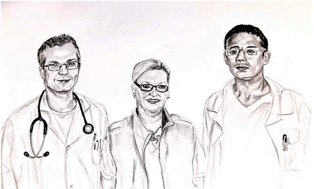
primár, vrchná sestra, ošetrojúci lekár