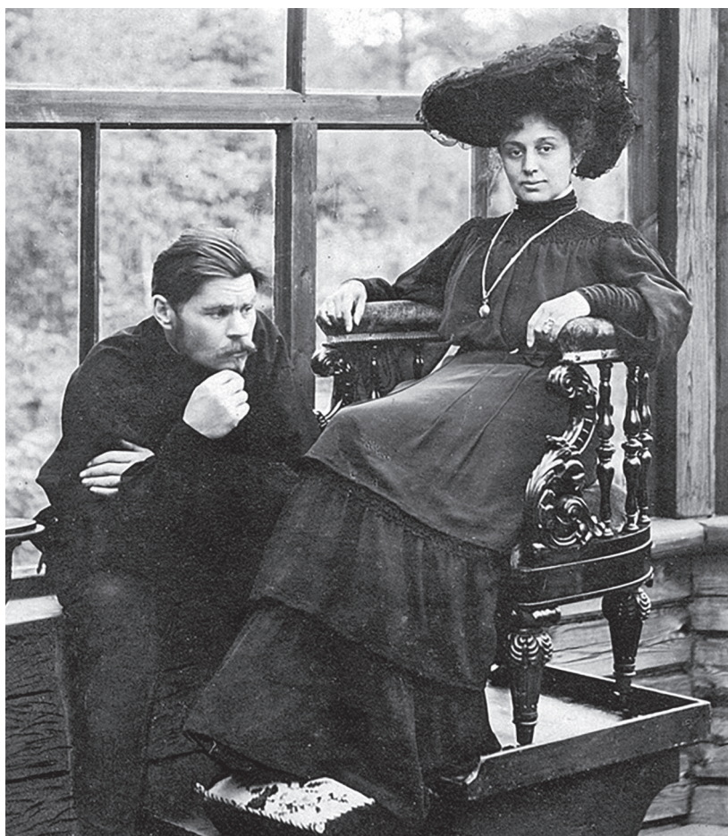
Majster a jeho Margaréta, čiže Maxim Gorkij (1868 – 1936) a Maria Andrejevová