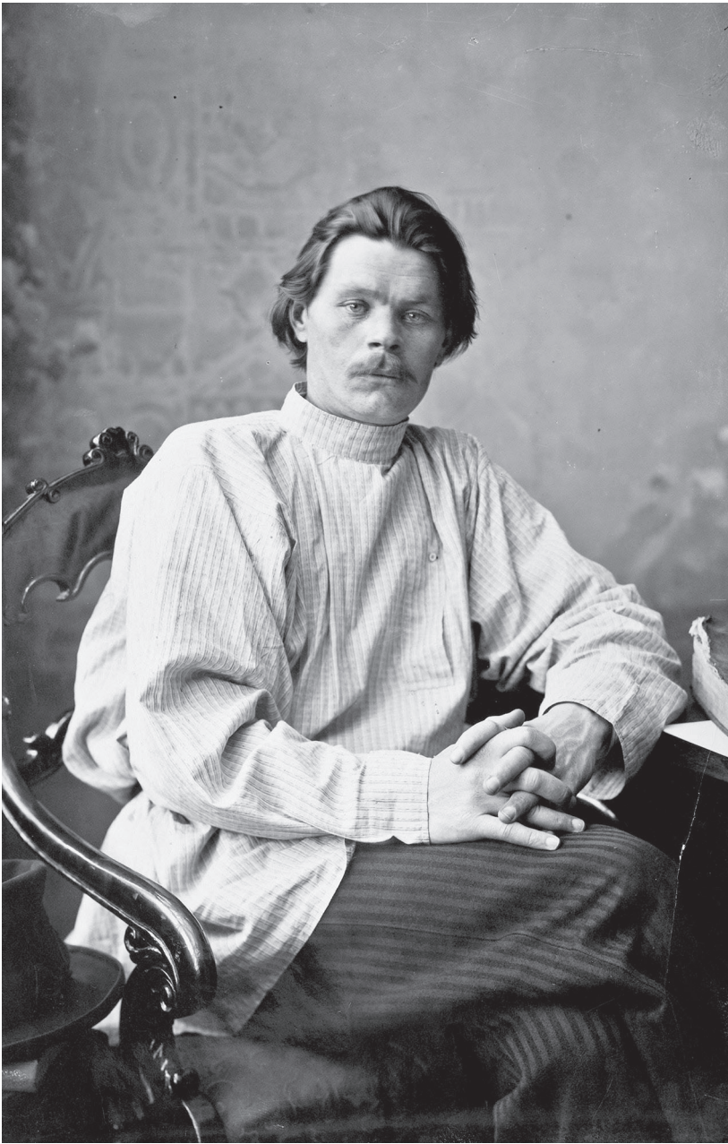
Maxim Gorkij (1868 – 1936)