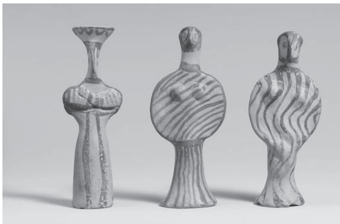
TERAKOTOVÉ FIGÚRY ŽENSKÝCH POSTÁV Z OBDOBIA MYKÉNSKEJ KULTÚRY.

Od roku 2200 pred n. l. začali do pevninského Grécka migrovať Indoeurópania. Vďaka svojim schopnostiam v boji a pri výrobe zbraní si dokázali zriadiť kmeňové monarchie. Potom si moc upevnili výstavbou opevnených citadel na strategických pozíciách po celom vidieku. Do roku 1600 pred n. l. sa už mnohé z nich rozrástli na mestá, ako napríklad Tirény, Pylos či Midea. Najdôležitejšou z týchto raných kolónií boli Mykény, po ktorých dostala meno aj celá civilizácia.