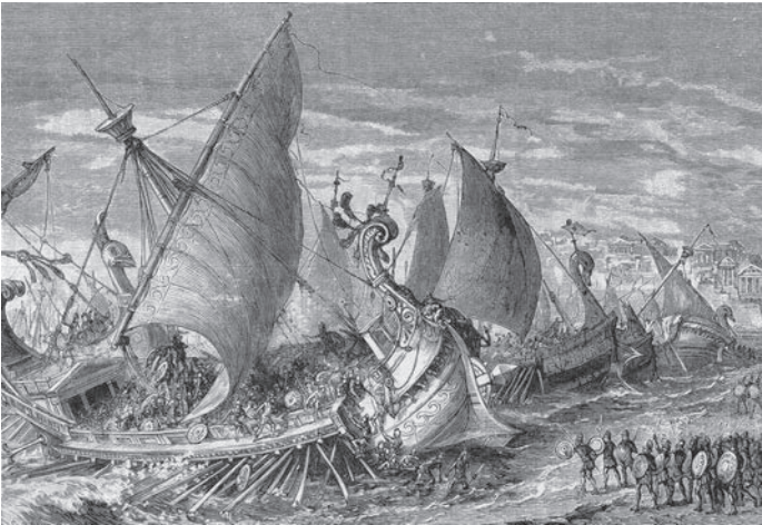
ATÉNSKE NÁMORNÉ SILY V PRÍSTAVE SYRAKÚZY NA SICÍLII POČAS PELOPONÉZSKEJ VOJNY.

Sparta sa ako mestský štát objavila v 10. storočí pred n. l. a okolo roku 650 pred n. l. už predstavovala významnú silu. Na rozdiel od ostatných mestských štátov nemala demokratické zriadenie, ale dvoch dedičných kráľov. Časom však prestali byť natoľko vplyvní a konali skôr ako bábky. Do popredia sa dostala rada starších ( gerúzia ) a volení úradníci ( efori ). Sparta bola vysoko militarizovaná – od každého občana sa očakávalo, že bude bojovať. Keď dieťa dovŕšilo sedem rokov, začínal sa preň striktný režim vojenského výcviku ( agoge ) a vo veku dvadsať rokov boli mladíci zverbovaní do armády. Fyzický a bojový tréning absolvovali aj spartské ženy, ktoré viedli domácnosť, kým boli muži na bojovej výprave.