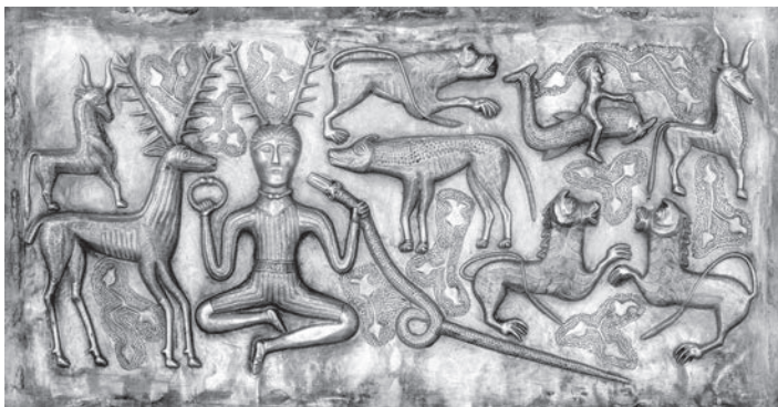
PREPRACOVANÁ GRAFIKA NA BOHATO ZDOBENEJ KELTSKEJ RITUÁLNEJ NÁDOBE Z GUNDESTRUPU (DNEŠNÉ DÁNSKO).

schopnostiam v boji či pri jazde na koni ovládli väčšinu regiónu a nadviazali obchodné styky s Grékmi. Nasledujúcou fázou rozvoja keltskej kultúry bola „laténska kultúra“ (pomenovaná podľa náleziska La Tène vo Švajčiarsku), ktorá sa objavila v 5. storočí pred n. l. Ich osobitý a prepracovaný umelecký štýl charakterizovali abstraktné zvlnené a zatočené krivky. Veľkú hodnotu tiež prisudzovali hudbe a poézii. Hoci Kelti vybudovali niektoré veľké opevnené sídla, boli prevažne poľnohospodárskou spoločnosťou. Vo všeobecnosti ich viedli polodediční králi a elitná šľachta bojovníkov. Ich náboženské rituály a úkony viedli profesionálni kňazi nazývaní druidi. Obdobie medzi 5. a 1. storočím pred n. l. bolo obdobím najväčšej keltskej expanzie, počas ktorej založili niekoľko nezávislých kráľovstiev. Na juhu sa dostali až do Španielska, na severe do Británie a Írska, vpadli dokonca do Grécka a potom sa vypravili až do Anatólie. Vtrhli na Apeninský polostrov do oblasti južne od Álp a boli neustálou hrozbou tvoriacej sa Rímskej republiky, pričom Rím vyplienili v roku 390 pred n. l.