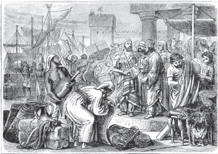
FENIČANIA BOLI ZNÁMI AKO ZDATNÍ REMESELNÍCI A OBCHODNÍCI.

dnešného Libanonu až po južné Španielsko. Počas 2. a 1. tisícročia pred n. l. vybudovala pobrežné obchodné kolónie v Levante, v severnej Afrike, v dnešnom Taliansku a v Španielsku. Feničia nebola formálnou ríšou, skôr voľným zväzkom mestských štátov. Feničania boli zruční moreplavci a stavitelia lodí, takže obchodovali s luxusným tovarom, napríklad s cédrovým drevom, vínom, so slonovinou a s výrobkami zo skla. Niektoré druhy tovaru dovážali na severe až do Británie, kde ich pravdepodobne vymieňali za cín, ktorý sa tam ťažil. Feničanov najviac preslávil farbený textil. Najvyhľadávanejšou a najdrahšou farbou bola „tyrská fialová“, ktorá sa vyrábala z výlučkov morských slimákov a prvýkrát sa vyrobila v meste Týra (v dnešnom Libanone). Bola taká neúmerne drahá, že si ju mohla dovoliť iba elita. Fialová farba sa tak čoskoro začala spájať s kráľovským či cisárskym postom.