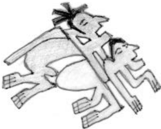
Souložící heterosexuální pár. Malba na nádobě kultury Nazca.

Obdobné procesy se odehrávaly i na americkém kontinentu. Na území dnešního Peru malovali již před více než deseti tisíci lety lovci divokých lam na skalní stěny scény z lovu těchto zvířat. Objevují se v nich i březí samice a muži se zdůrazněnými genitáliemi. Tyto malby byly součástí magických rituálů, jejichž cílem bylo zajistit dobrý lov a zplodění dostatečného počtu zvířat důležitých pro přežití.