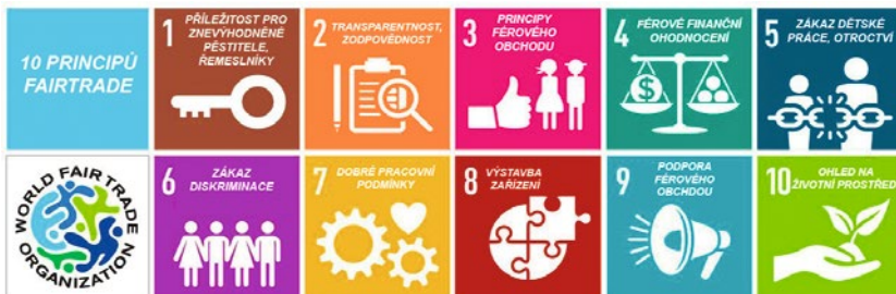
Obr. 1.1: Deset principů fair tradu

Všechny organizace používají v maximálním rozsahu recyklované nebo jednoduše biologicky odbouratelné obalové materiály, a je-li to možné, zboží je dopravováno po moři (10 Principles of Fair Trade., n. d.; Základní principy, n. d.). 2