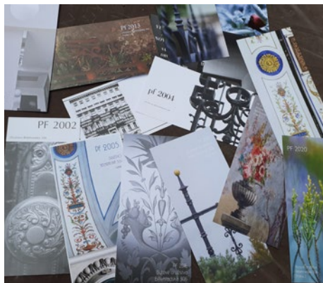
Novoročenky jsou neobvyklou tradicí tohoto domu a jeho dvorku. Jejich motivem je vždy i některá z jeho typických součástí. Jednou je to zábradlí z domovní chodby, podruhé třeba schůdky mezi horním a spodním dvorkem.