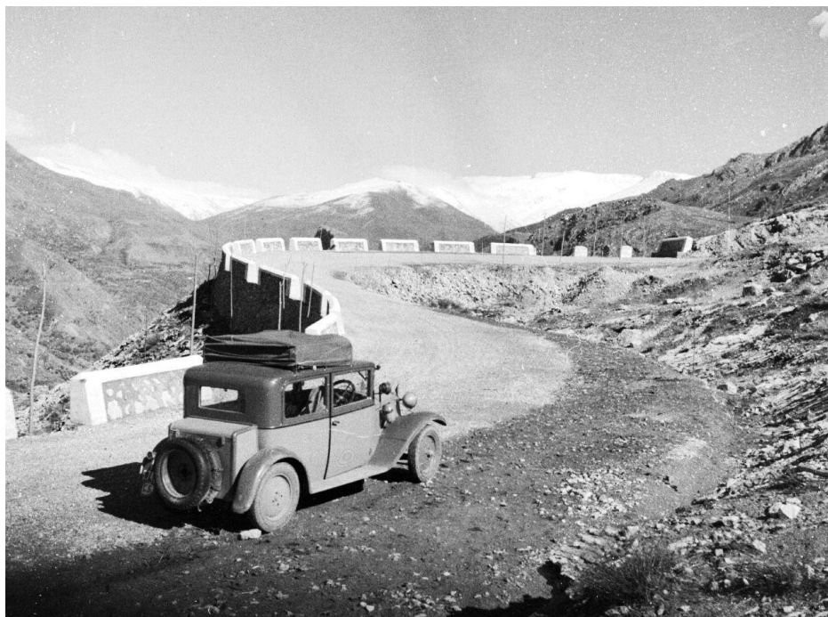
Auto na silnici v pohoří Sierra Nevada