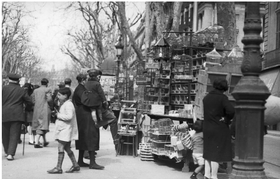
Ptáčník na Las Ramblas

První, co na cestě vždy přichází v úvahu, je najít přístřeší, umýt se a odpočinout si po únavě z cestování i dojmů. Pak zpravidla zvědavost nutí jít si prohlídnout nejbližší okolí a místní zajímavosti.