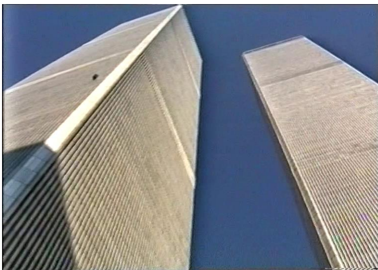
WTC, dvojičky (rok 2000)