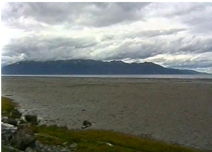
Cookov záliv pri odlive

Na cestu na sever nemôžeme ani pomyslieť bez riadneho oblečenia, obutia a ostatných potrieb. Po dôkladnej úvahe sa rozhodneme zmeniť naše plány. Aby sme nestrácali čas, pokiaľ sa naša batožina nájde (stále v to pevne veríme), prezrieme si Národný park Kenai Fjords na Kenaiskom polostrove.