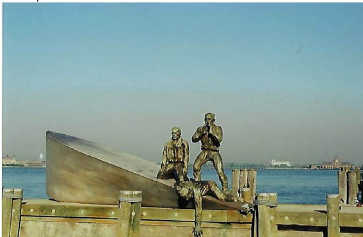
Súsošie v Battery parku

šom cípe dnešného Manhattanu. Veľmi dobre vidieť ostrov Ellis Is-