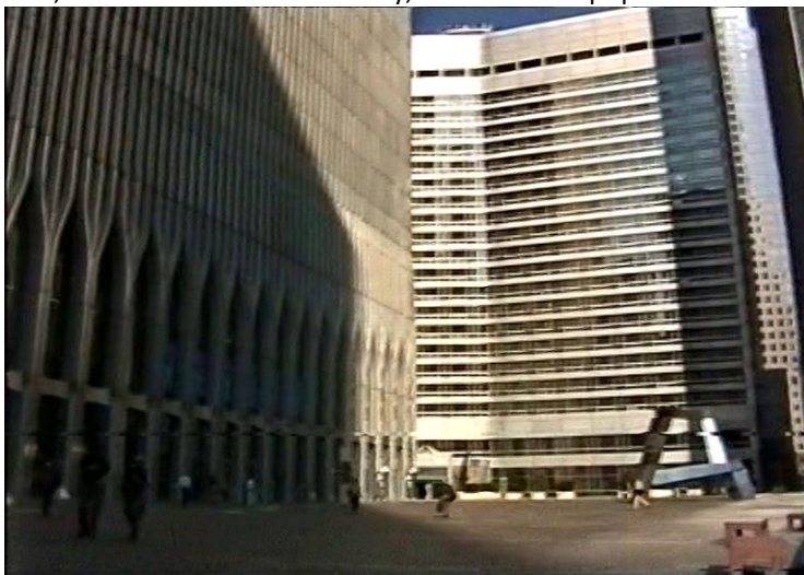
World Trade Center (rok 2000)

V hĺbke pod nami sa rozprestiera mesto zahalené šedastým oparom, v diaľke vidím sochu slobody, ktorá odtiaľto pripomína detskú