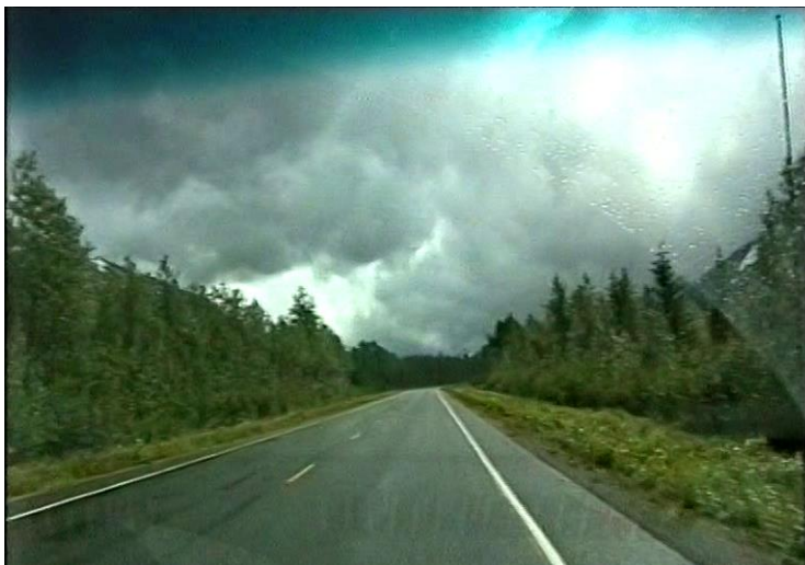
Cesta do Sewardu

údajne najväčší odliv na svete. Rozdiel medzi prílivom a odlivom je viac ako 14 metrov a prichádza dvakrát denne. Rybári na pobreží tento jav dokonale poznajú, ale pre cudzích sú tu výstražné tabule, ktorých text: „Warning. Dangerous watters and mud flats,“ upozorňuje na možnosť ohrozenia života pri rýchlo stúpajúcom prílive.