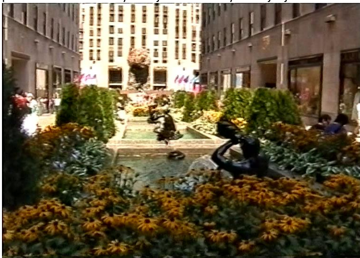
Pred Rockefeller Center

svete módy: Lord a Taylor, Saks, Cartier. Zaujmu nás kamenné levy pred vchodom do newyorskej Public Library - verejnej knihovne.