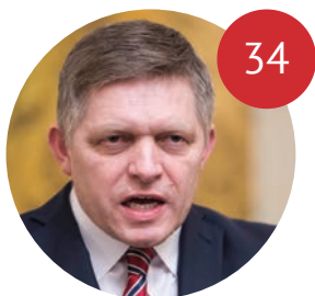
SLOBODA MÉDIÍ PO SLOVENSKY