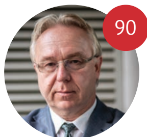
PROKURÁTOR NEMÔŽE MAŤ STRACH