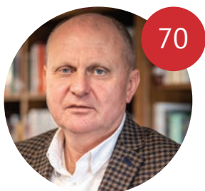
FICO SA SPRÁVA AKO FEUDÁL