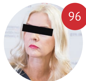
RÝCHLY VZOSTUP, STRMÝ PÁD