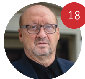
OLIGARCHOVIA V ŠPORTE