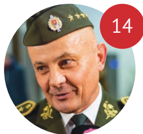
PRÍSNE TAJNÉ: MAJETOK ŠÉFA TAJNÝCH