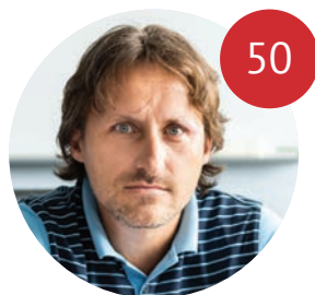
POCHYBNÉ MAJETKY KONTROLÓRA PODVODOV