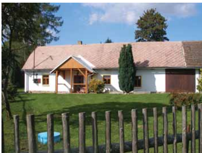
Vzorně udržovaná zahrada Marvanovy chalupy láká i dnes k posezení