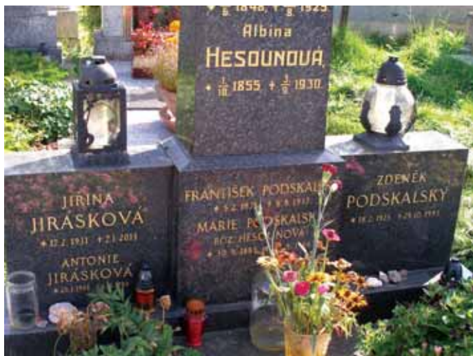
Jiřina Jirásková a Zdeněk Podskalský jsou pochováni na malenickém hřbitově