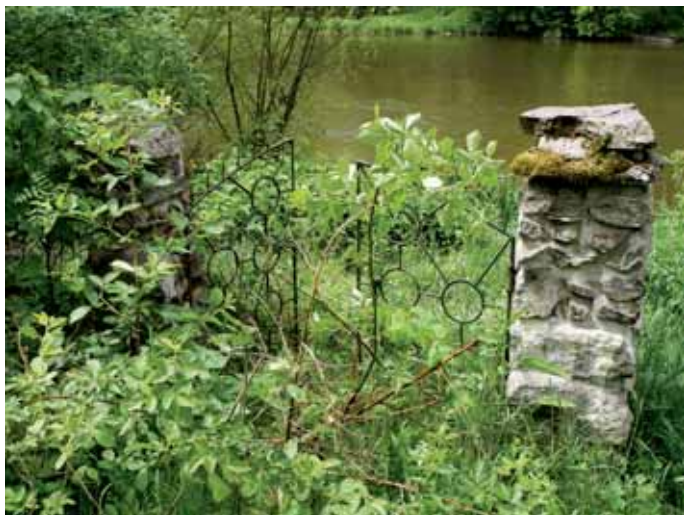
Blíž k rybám a k řece to Rudolf Hrušínský snad ani nemohl mít