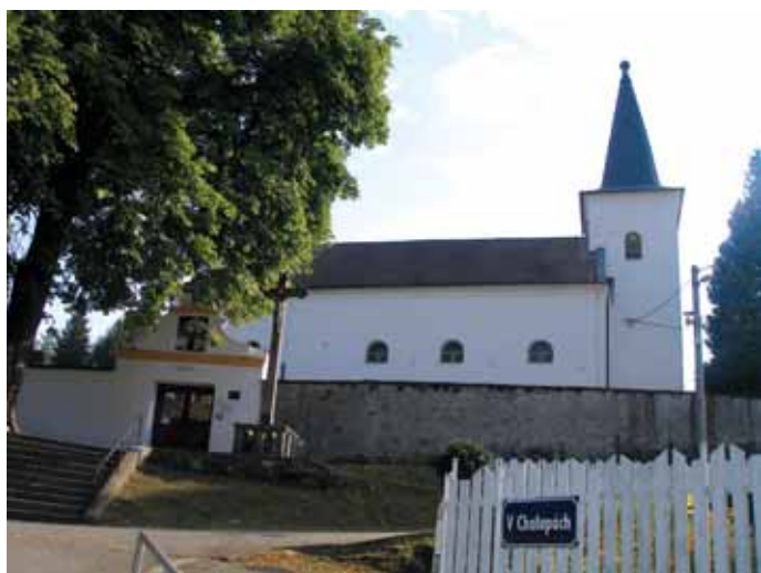
Dnešní podoba kostela svatého Jakuba Většího, který stojí tamtéž, pochází z roku 1885