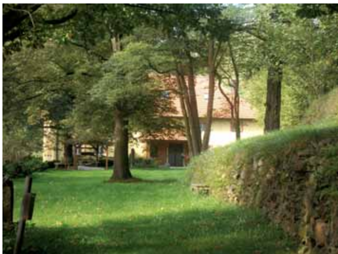
Červený mlýn, jihočeské letní sídlo Miloše Kopeckého