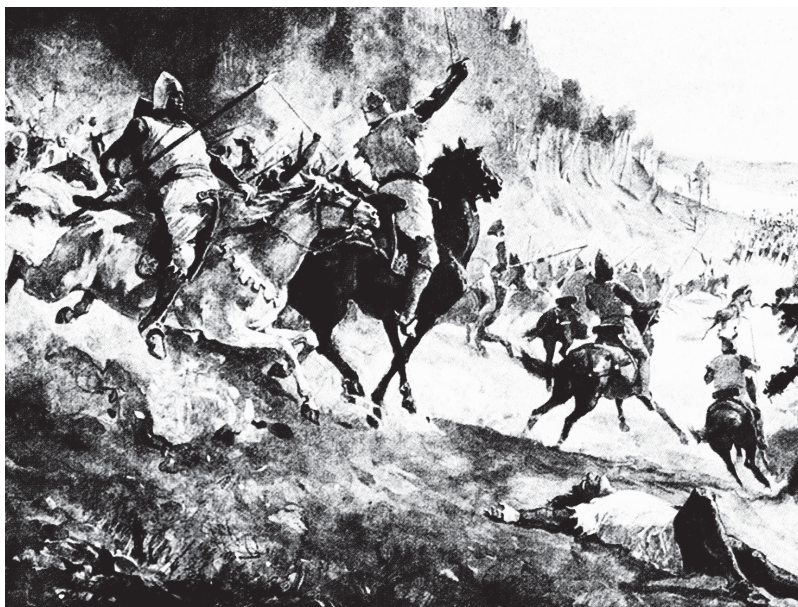
Vítězství Přemysla Otakara II. nad uherským vojskem u Kressenbrunnu

Proto taky ani nic nevíme o jeho matce či o tom, kdy se narodil. Dá se však předpokládat, že se jeho matka zdržovala někde v králově okolí, zřejmě na jeho dvoře, tudíž o něm Přemysl věděl a mohl se postarat o jeho další kariéru. Tentokrát se zřejmě za svůj hříšný skutek kál a milého Jana určil pro kněžskou dráhu a dal studovat bohosloví. Což, jak víme, byl klasický postup při určování dalšího osudu královských levobočků.