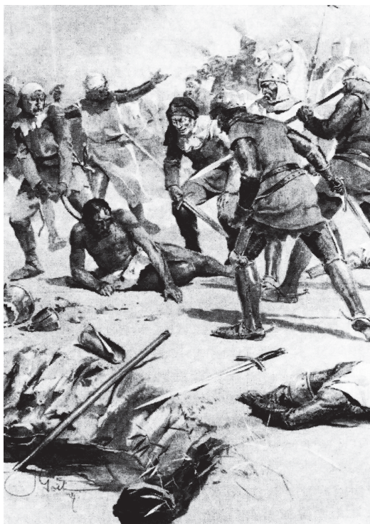
Smrt Přemysla Otakara II. na Moravském poli

bylo povážlivě málo. Marně vyhlížel další posily z brněnského zeměpanského hradu Špilberku. Přesto, jak připomíná František Palacký, „byl Otakar dobré mysli, když manželce své – tuším jen, aby ji potěšil, – dával z Brna věděti, že hodlal hnouti se odtud dne 15. července s celým vojskem do Rakous, kdežto Rudolf meškaje neměl prý naděje na brzkou pomoc...“