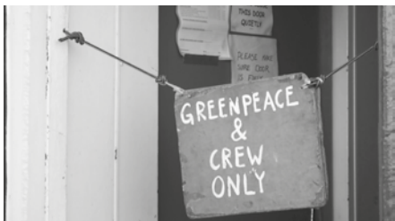
36| Greenpeace: pól storočia boja Klimakemp 2020, foto: Peter Tkáč.