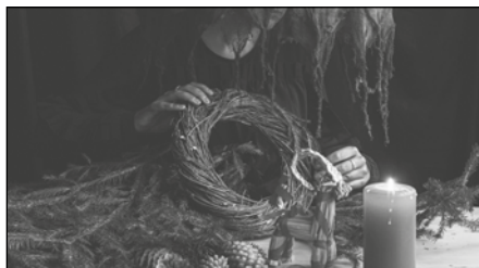
73| Komerční rozměr Vánoc nikdy neustoupí