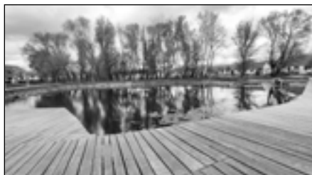
41| Na Bahně: náves, která budí pozornost