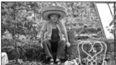
16| Územní plán, zahrádky a já foto: Zahrádkářská kolonie Kraví hora II