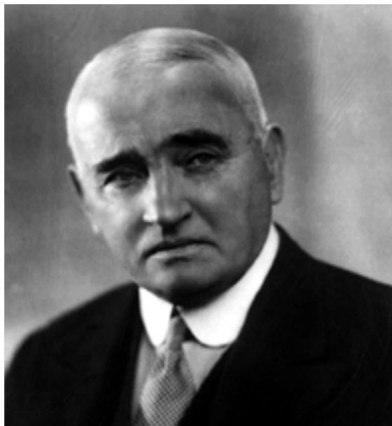
Obr. 1.2 William Ernest Miles

a v blízkosti bifurkace levé arteria iliaca communis . 12 Tyto oblasti označil jako zóny šíření karcinomu směrem nahoru („ upward zone of spread “). Miles pochopil, že exstirpace rekta perineálním přístupem není dostatečně radikální, protože neřeší příčinu lokální recidivy (nekompletní excize mezorekta a jeho lymfovaskulárního zásobení). Navrhl proto onkochirurgicky radikální operaci abdominoperineálním přístupem s cílem odstranit rektum společně s jeho lymfatickou drenáží. Vzhledem k velmi vysoké pooperační mortalitě kombinovaného operačního přístupu (až 42 %) byl operační výkon prováděn ve dvou dobách – abdominální a perineální fáze operace.