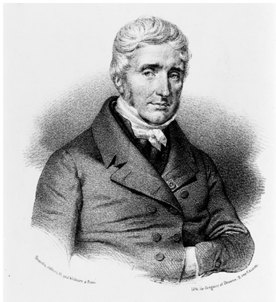
Obr. 1.1 Jacques Lisfranc

Zavedení anestezie a antiseptiky do klinické praxe ve druhé polovině 19. století umožnilo operovat v oblasti rektá v rozsahu dříve nebyvalém. Nejdříve se rozvíjely techniky exstirpace z perineálního přístupu. Profesor Theodor Billroth, považovaný za zakladatele viscerální chirurgie, v letech 1860–1872 u více než 40 pacientů exstirpoval rektum z perineálního přístupu. 1,5 Důležitou techniku exstirpace z perineálního přístupu vypracoval německý profesor Paul Kraske (Univerzita Freiburg, Německo) v roce 1885. Kraskeho zadní operační přístup byl založen na vytvoření širokého přístupu k rektu resekci kostrče a distální levé části kosti křížové. Byla provedena vysoká ligatura arteria rectalis superior s mobilizací orálního rektá umožňující resekci zdravé části střeva v dostatečné vzdálenosti od nádoru (nejméně 1 cm zdravé tkáně orálním i aborálním směrem). Orální konec