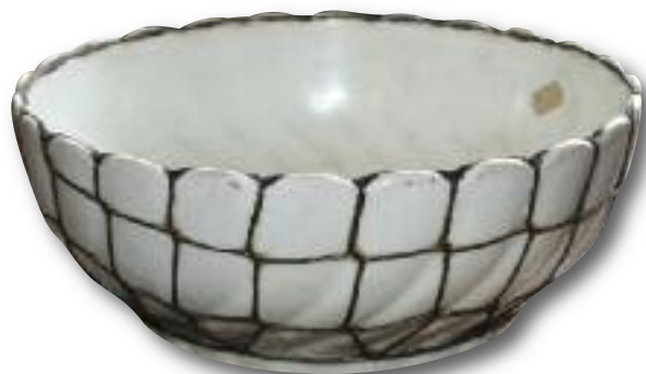
Drátovaná mísa, 20. stol. (skanzen Přerov n.L.)