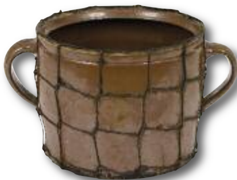
Drátovaný kameninový hrnec, 1. polovina 20. stol. (Muzeum romské kultury)