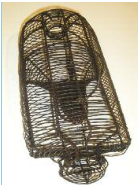
Past na myši (PM Žilina)

zvláště pokud se nechovali náležitě. Stačilo, když dráteník neměl u sebe platný cestovní pas, alespoň malé množství peněz, žebral či byl opilý.