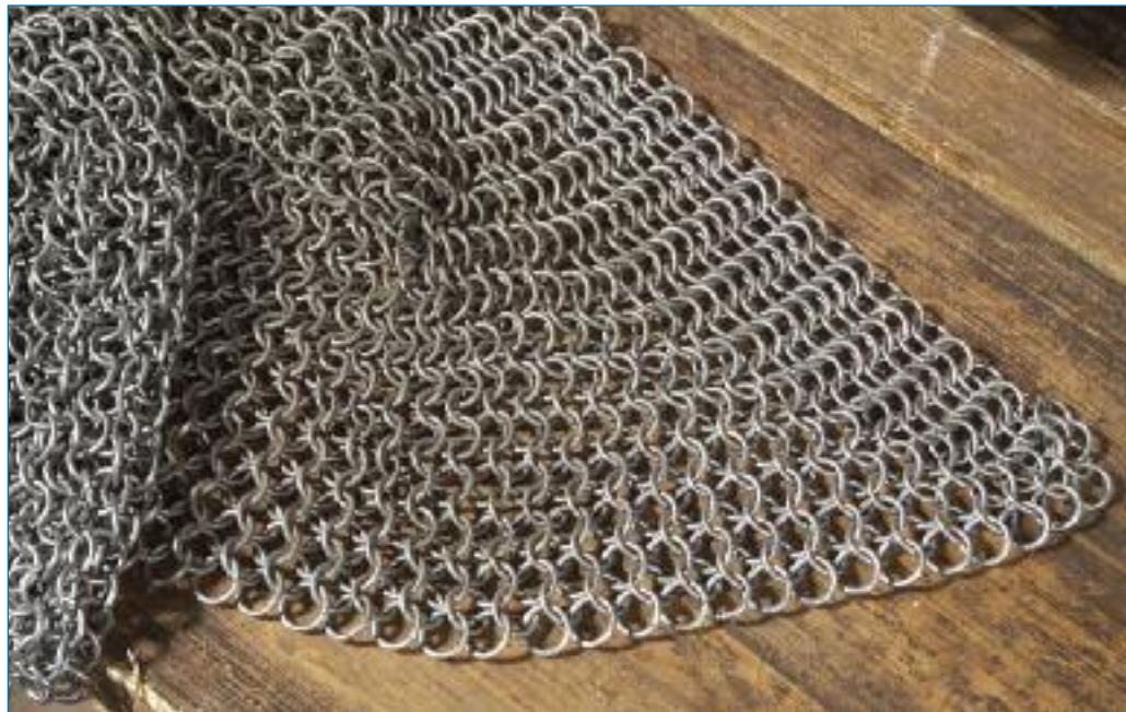
Drátěná košile (rekonstrukce Three Brothers Production)

Je zajímavé, že již v pravěku se drát užíval také k opravám hliněných nádob. Původně si lidé prasklé hrnce stahovali pomocí konopného provazu, s rozšířením výroby kovového drátu si však kdosi všiml, že jeho užití pro tento účel je výhodnější, neboť je trvanlivější, není pružný a ve vlhku se neuvolňuje. A tak se začaly železné dráty už v keltském prostředí (cca 5. – 4. stol. př. n. l.) užívat místo provazů k jednoduchému stažení prasklé keramiky, zvanému heftování. Na protilehlých stranách praskliny se vyvrtaly dírky, jimiž se provlékl drát a pevně se stáhl. Zajímavá kolekce střepů misek a hrnců s navrtanými otvory (v jednom se dokonce dochoval kousek železného drátu) byla objevena roku 1973 při výzkumu keltské osady Chýnov (dnes součást středočeských Libčic nad Vltavou severně od Prahy).