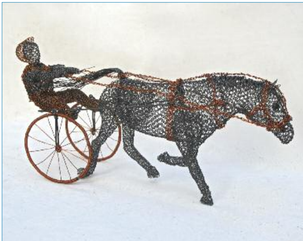
Klusák, Ladislav Šlechta, 2012, v. 15 cm