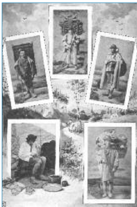
Slováci ve světě - sklář, sklenář, hadrář, dráteník, kloboučník (Český lid 1904)

Právě vandrování umožnilo, aby se drátenictví rozvinulo a mohlo uživit tak veliké množství rodin. Venkovští kováři, truhláři, hrnčíři či tesaři potřebovali ke své práci vybavenou dílnu, navíc jejich profese byla v podstatě běžná a zastoupená v každé větš