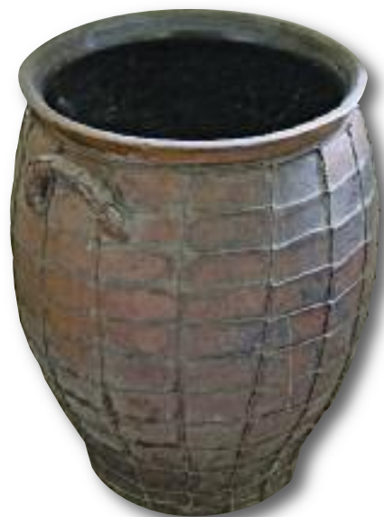
Drátovaná zásobnice, 19. stol. (skanzen Třebíz)

roku 1811). To vše znamenalo další snižování příjmů venkova. Zachovaly se jen útržkovité zprávy z pramenů, sepsaných v souvislosti s vedením běžné vrchnostenské správní agendy a z informací venkovských farářů. Lacos lze vyčíst i z centrálních přehledů, které nechala zpracovat vídeňská vláda k posouzení stavu monarchie. Všechny ukazují na zhoršení životních podmínek prostého lidu. Počet obyvatel Slovenska se v 18. století pohyboval kolem jednoho milionu. S ohledem na hospodářské možnosti země to bylo příliš, a mnozí obyvatelé měli proto problém vydělat si na živobytí. Nejhorší situace v Horních Uhrách byla právě v severních oblastech – v horním Pováží, na Kysucku, Oravě a Liptově. Podle jedné zprávy rakouských komisařů byli lidé podvyživení, domy polorozpadlé a zemědělská půda zanedbaná. Tuto zprávu sice sepsali v době hladomoru po neúrodných letech, ale pravdou