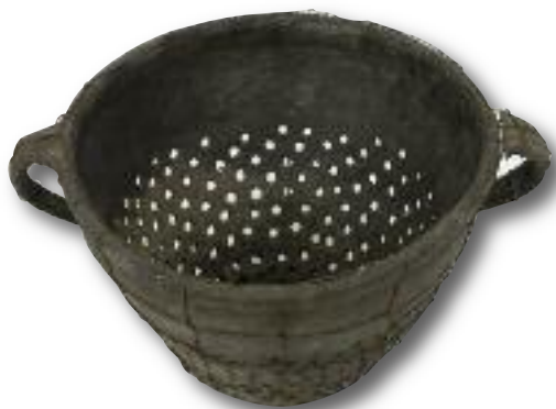
Cedník na povidla, počátek 20. stol. (Muzeum romské kultury)

což je na svou dobu ohromující číslo. Dráteník se pro středoevropské země stal dokonce synonymem pro obyvatele Horních Uher – Slováka.