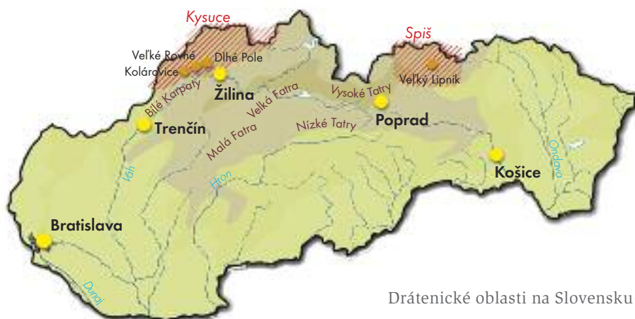
Drátenické oblasti na Slovensku

trochu jiný než na severozápadě v Pováží, neboť zdejší krajina byla odlišná; především tu nebyly tak vysoké hory. Nerozvinul se salašnický způsob chovu ovcí a zemědělská výroba se více orientovala na pěstování obilí a nížinný chov dobytka. Proto zde byla i v době hospodářské recese v 18. století lepší možnost obživy, neboť lidé z venkova mohli pracovat pro bohatá spišská města. Situace se radikálně změnila až v 19. století, kdy s úpadkem hornictví zchudla tamní města a s nimi i venkov. Teprve v té době se místní lidé začali ve větší míře živit drátenictvím.