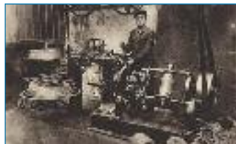
Výroba drátů z počátku 20. stol.

Rozvoj drátenictví byl umožněn i snadnou dostupností potřebného materiálu. V sousedním Slezsku existovala od 16. století rozvinutá železářská výroba (hamry, později hutě), od 18. století fungovaly ve Slezsku drátovny a sklady drátů. Ani doprava nebyla problémem, protože do Slezska nebylo daleko a navíc přes Žilinu jezdili pravidelně formani s nákladem zboží do Bratislavy a do Vídně. Drátenická technika byla ve své podstatě jednodu-