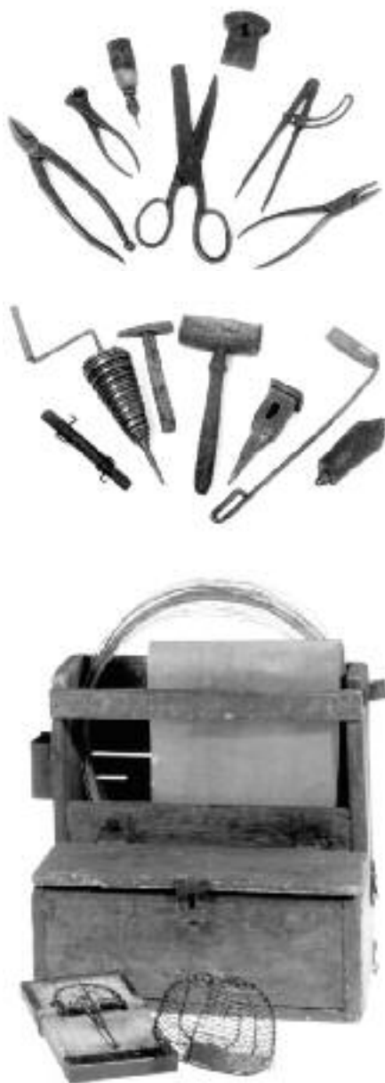
Dřevěná krosna a drátenické nářadí (PM Žilina)

Druhou drátenickou oblastí byla nevelká, ale historicky velice zajímavá krajina jihovýchodně od Vysokých Tater – Spiš. Ve středověku byla jedním z nejvýznamnějších středisek hornictví a na něj navazující řemeslné výroby na Slovensku. V té době krajinu osídlili němečtí kolonisté. Později sem přicházeli uprchlíci z východu, především ze Sedmihradska. Charakter kolonizace pustých svahů na Spiši byl však