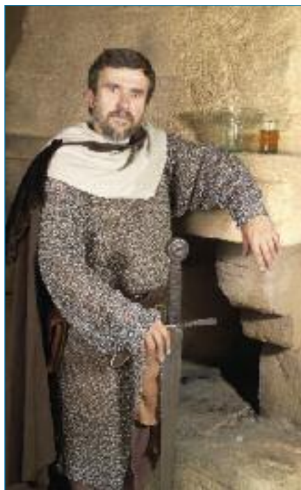
Oděv středověkého rytíře (rekonstrukce Three Brothers Production)

Postup zhotovení drátěných košil spočíval ve vzájemném navazování kovových kroužků a jejich spojování nýtky. Kroužky přitom zůstávaly volné, takže oděnění bylo elastické a neomezovalo vojáka v pohybu. Původně