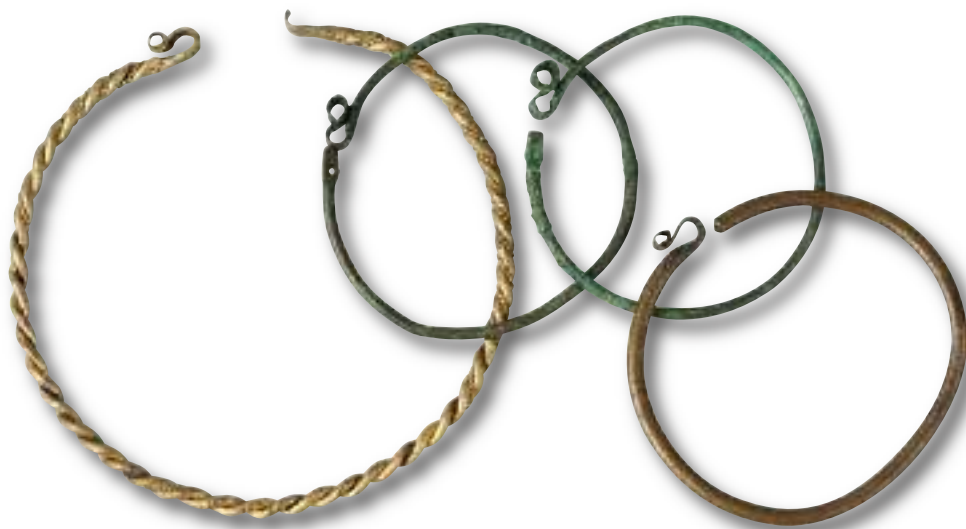
Záušnice (muzeum Brandýs n. Labem)

S rozvojem středověkých řemesel se železný drát začal ve větší míře uplatňovat ve městech i na venkově jako materiál pro zhotovování jednoduchých pomůcek pro domácnost a hospodářství nebo částí zemědělského nářadí. Používal se ovšem výhradně tam, kde se nedal nahradit levnějšími materiály, jako lýko, loubek, dřevo apod. Kovové výrobky byly drahé a až do třicetileté války se považovaly spíše za luxus. Nicméně už před husitskými válkami se dráty objevují při vázání žebřin vozů, spojování klečí pluhů, jako ucha vědýrek apod. Oblíbené byly také k ovíjení střenek nožů a rukojetí dýk a mečů.