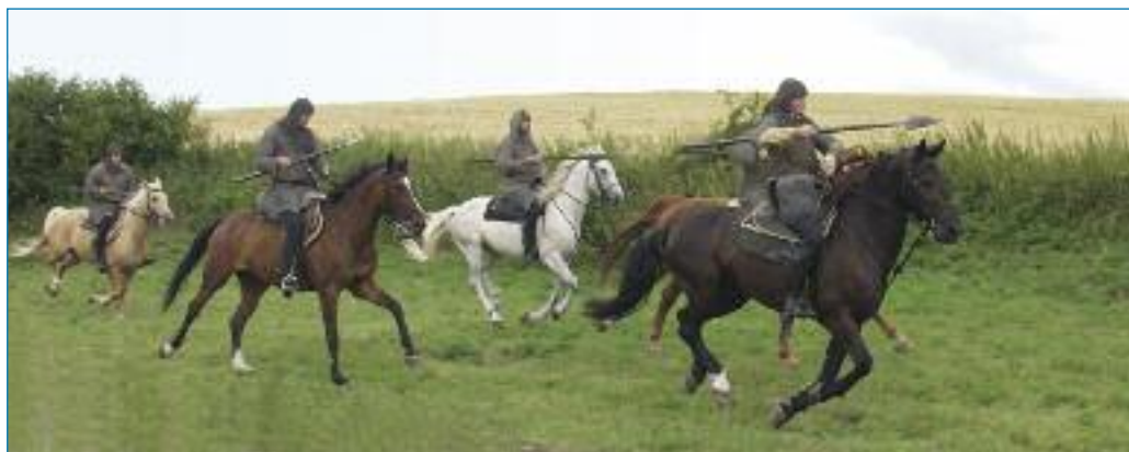
Jezdci v dobové zbroji (rekonstrukce Three Brothers Production)