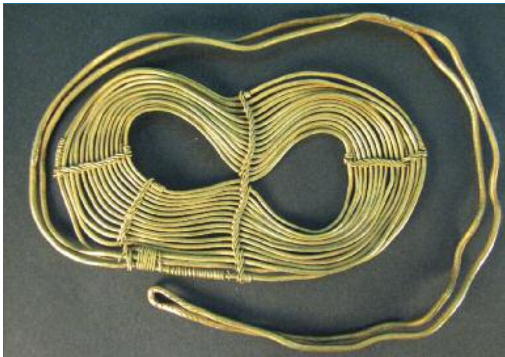
Hradecká zlatá osmička, d. 12,5 cm (muzeum Hradec Králové)

Drát byl zpočátku, jako ostatně vše, co se z kovu vyrábělo, velice drahý, a proto sloužil hlavně ke zhotovování ozdob určených pro členy nejbohatších rodin. Užíval se zejména k výrobě šperků (jehlic, spon, náramků, oblíbených záušnic či keltských nákrčníků), ale také kultovních předmětů a votivních darů v podobě stylizovaných