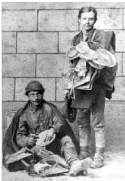
Vandrovní dráteníci ve Vídni v roce 1878