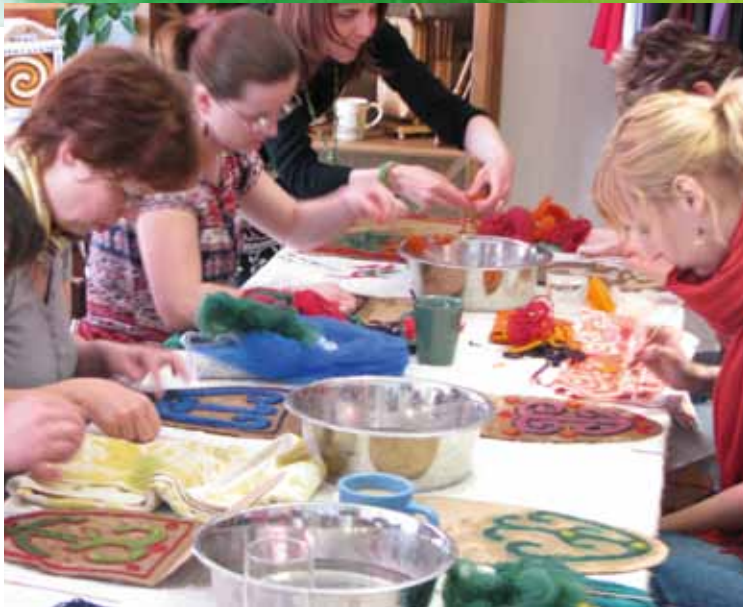
Z kurzu plstění

Plstěné koberce jsou plné vzorů, vytvářejí se z barevné ovčí vlny, většinou je to ženská práce. Zajímavé by bylo zabývat se i symbolikou pradávných vzorů, tvary i barvy v kobercích nejsou náhodou, ukrývají v sobě víc, než můžeme pouhým okem odhalit. Nejen zvláštní harmonii v pravidelnosti, ale i hlubší význam jednoduchých forem můžeme cítit, postupným bádáním i objevovat. Velkou předností vzorů je jednoduchost a zřetelnost. Pokusíme se