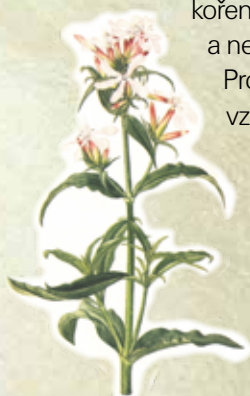
Mydlice lékařská Saponaria officinalis L.

Zajímavé a velmi šetrné by bylo použít rostlinný saponát z mydlice lékařské. Tato krásná plevelnatá rostlina obsahuje poměrně velké množství saponinu. Dříve než byla rozvinuta výroba mýdla, používala se na mytí a praní. Nejčastěji se vezme kořen, který se nadrobno pokrájí a nechá louhovat v horké vodě. Pro ochranu rostliny můžeme vzít celou rostlinu a kořen ponechat, i tehdy ji pokrájíme na drobno a louhujeme v horké vodě, v lahvi můžeme protřepat a urychlit tím její napěnění. Tento jemný rostlinný prací prostředek je výborný právě na živočišná vlákna, pro vlnu tedy ideální.