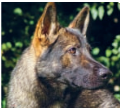
Služební nos: jeho příbuzní často čenichají ve službách policie – Quinn.

mohou zpracovávat pachové látky rozpuštěné v tekutině.