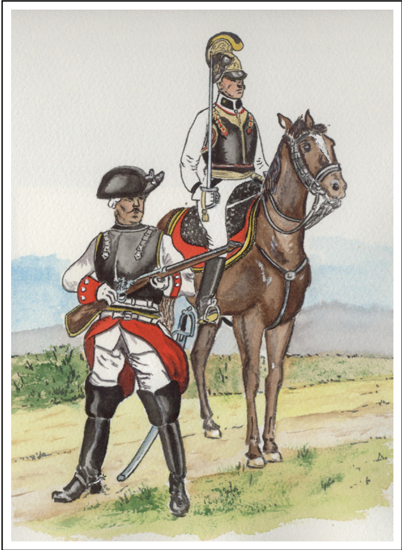
Kyrysník karabínierskej kompánie pluku Schmerzing vyzbrojený trombónom (r. 1760), na koni dôstojník kyrysníckeho pluku M. Liechtenstein (1810)