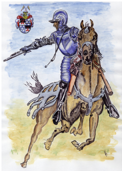
Útočiaci kyrysník, obdobie 30-ročnej vojny

karabínami a dobre vycvičení v rýchlej strelbe. Ďalšia výzbroj bola zhodná s výzbrojou ostatných príslušníkov pluku. Pre karabinierov platili osobitné predpisy počas presunu, pobytu v tábore aj pri nasadení proti nepriateľovi. Stav pluku, ktorý bol dovtedy okolo tisíc mužov, sa začiatkom vojny proti Turkom zvýšil (asi 1094 mužov, 12 kompánií po 83 - 84 mužov, karabinierska kompánia mala 98 mužov) a platil aj v nasledujúcich rokoch ako normatívny počet.