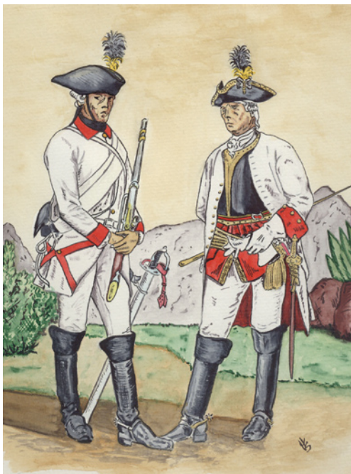
Zľava: kyrysník (r. 1765) a dôstojník (r. 1770) pluku D'ayasasa

Zrušili sa aj bubny a namiesto plukovného bubeníka bol zavedený štábný trubač . Pôvodný mierový stav eskadrony - 118 mužov - bol novostanovený na 168 (z toho 145 jazdcov). Pluky sa podľa nového vzoru objavili až v r. 1775. V čase vojny sa mierový stav štábu (pätnásť dôstojníkov) zvýšil o dvoch chirurgov ( Stabs-Feldscher ) a stav pluku o záložnú eskadronu (137 mužov), takže celkový stav pluku bol 1163 mužov. Nové predpisy pre výstroj a výzbroj z r. 1765 - 1771 sa u kyrysníkov prejavili nasledovne: Okrem niektorých detailov bol zavedený nový druh pláštá ( roquelaur ) a namiesto kamizolu kazajka, ďalej nohavice na prezlečenie, zástera či čiapka, ktoré sa nosili počas služby v tábore a pri práci v stajni. Nohavice a vesty dôstojníkov mali okerovožltú farbu ( paillegelb ). Pokiaľ išlo o výzbroj, bolo nariadené, že okrem výprav proti Turkom majú kyrysníci nosiť iba polovičný (predný) kyrys. Ďalej