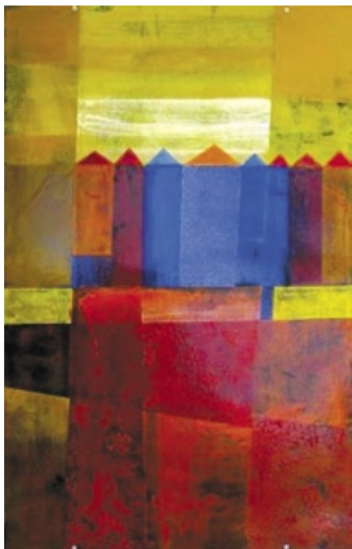
Annemarie Timmer (Nizozemí), Vesnice na Slunci, smalt na oceli, 50 × 70 cm