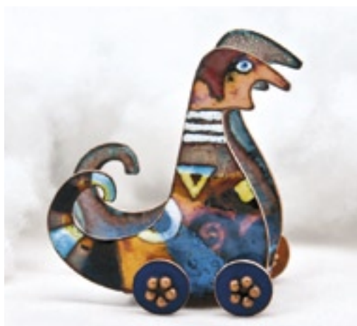
Radka Urbanová (ČR), Školáci ze souhvězdí Labutě, smalt na mědi, 70 × 70 mm