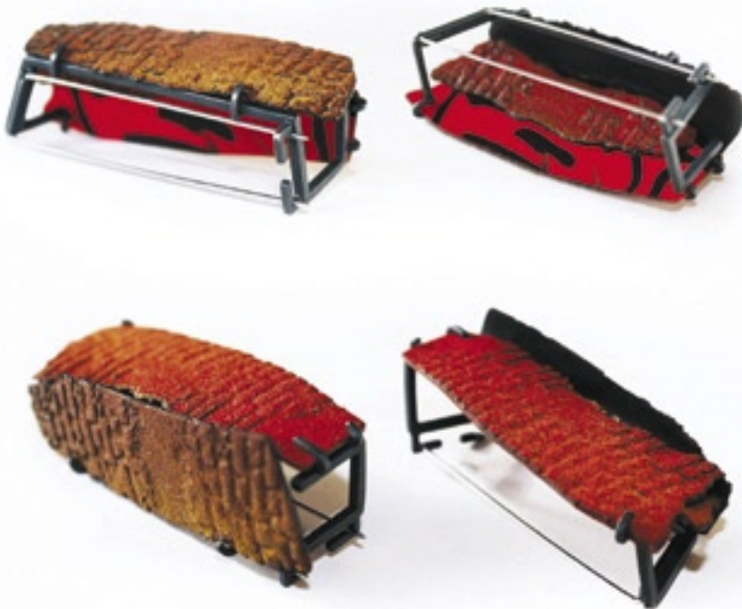
Han-Chieh Chuang (Taiwan), Červená cihla, brož, měď, stříbro, smalt