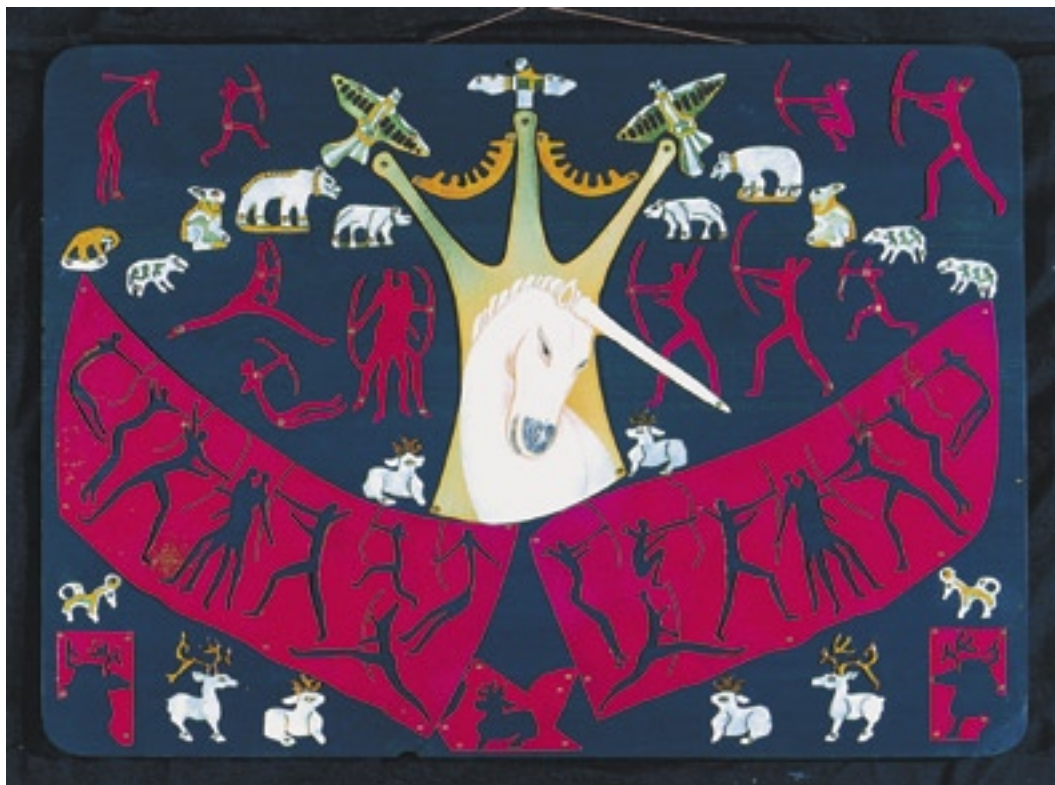
Szvetlána Tóth (Rusko), Lov na jednorožce, měď, smalt, dřevo, 45 × 65 cm

Každý má ke smaltu jiný přístup, někdo si vše pečlivě plánuje, zapisuje, studuje dostupné návody a knihy, někdo naopak impulzivně zkouší u pece a hledá bez pravidel a návodů. Mně je bližší spíše druhý přístup. Přesto mi dlouhá léta souhrnná publikace o smaltu u nás chyběla. K napsání této knihy jsem se rozhodla po dvaceti letech praxe bez četby návodů, přesto doufám, že poznatky uvedené v této publikaci mohou někomu dalšímu jeho cestu usnadnit.