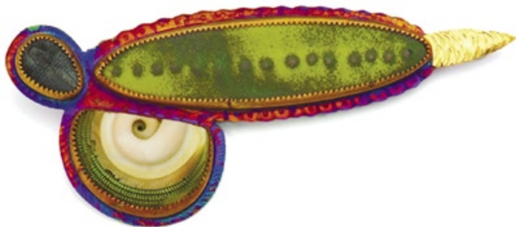
Julie Shaw (USA), Průzkum, brož, smalt, stříbro 925/100, zlato, trilobit, mušle, 7,6 × 3,8 cm