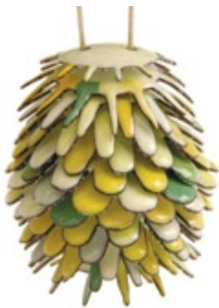
Jennaca Davies (USA), Žlutý a bílý přívěšek, měď, smalt