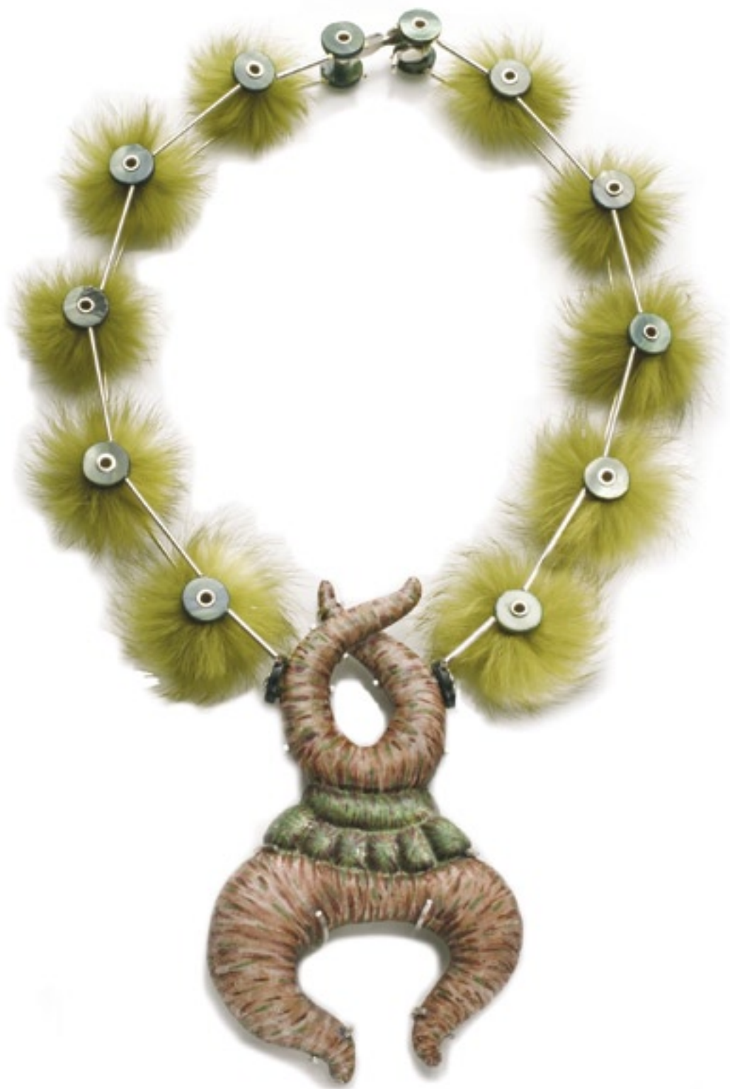
Shana Kroiz (USA), Královská tanečnice, stříbro 925/1000, perleť, kožešina, smalt na mědi, galvanoplastika