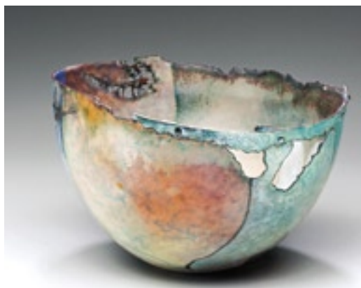
Judy Stone (USA), nádoba, měď, smalt