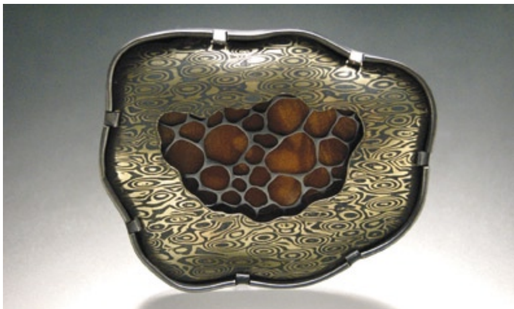
Michelle Startzman (USA), Neznámo, brož, smalt s obtiskem, měď, mokume-gane