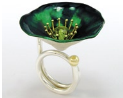
Stefano Pedonesi (Itálie), Závěsný květ, stříbro 925/1000, zlato 750/1000, smalt, hydrothermal quartz