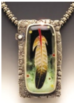
Linda Lundell (USA), Posvátné pírko, zlato 999/1000 (drátky cloisonné), základ stříbro 999/1000