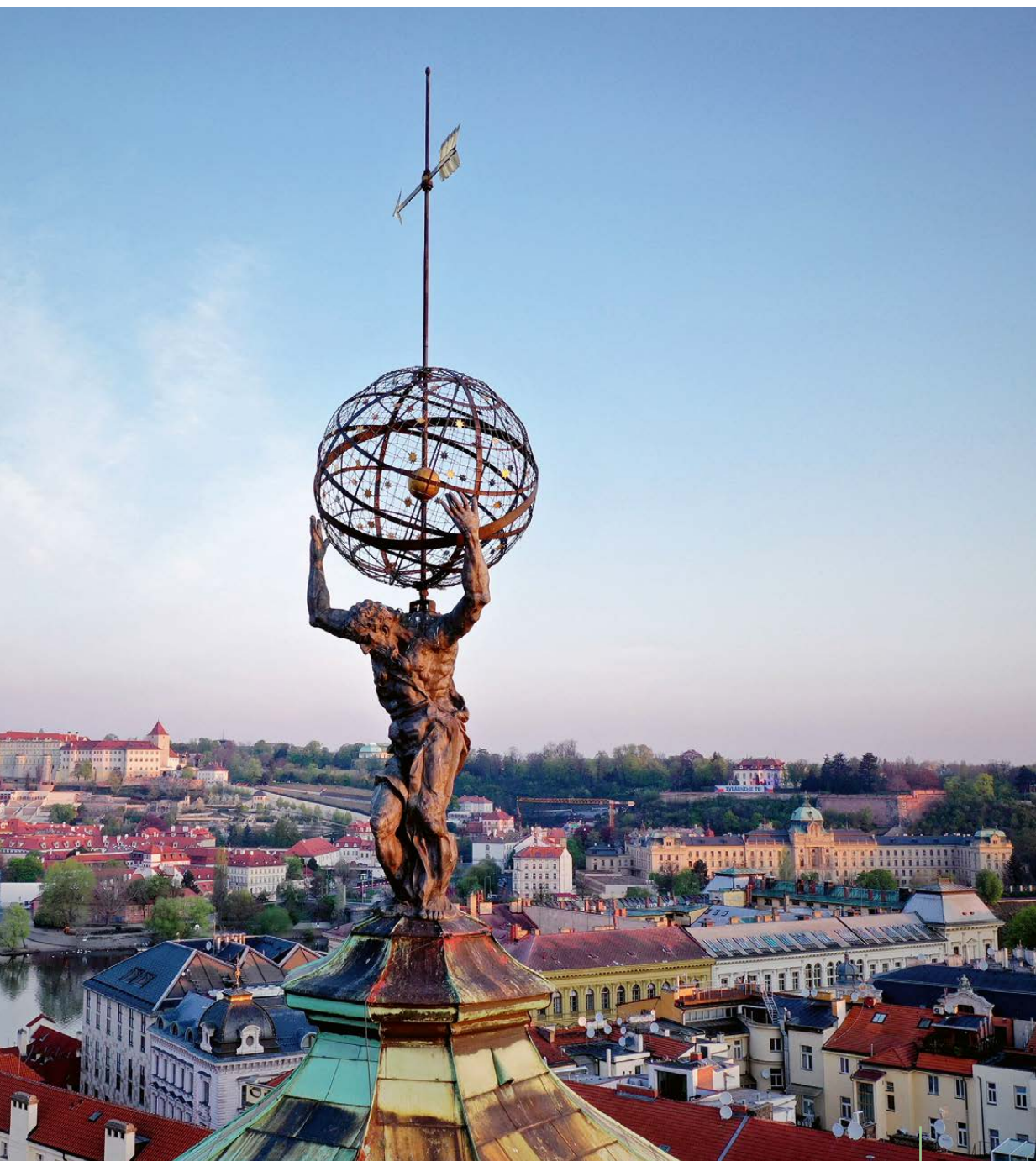
Socha bájného Atlase nesoucího na ramenu tíži světa na vrcholu Astronomické věže Klementina, kde se počasí zapisuje už od roku 1775. Sochu vytvořil Matyáš Bernard Braun (1684–1738), který má několik soch také na pražském Karlově mostě.