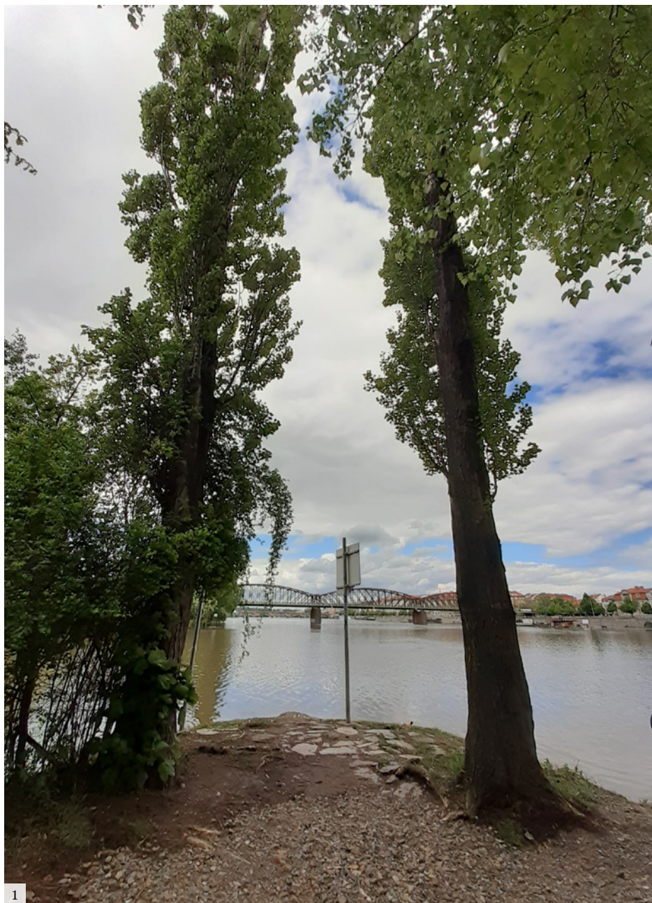
1. Topoly, které na Císařské louce naproti železničnímu mostu vysadil Karel Vostrovský, aby vítaly jeho vnučku Leonu z cest.