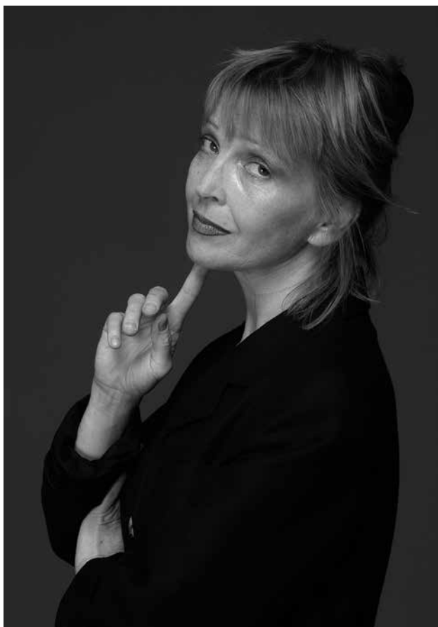
Herečka i spisovatelka v jednom