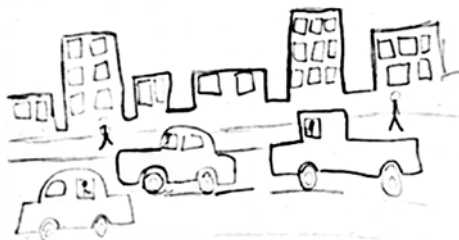
Obr. 3 a 4 Kresby s prvky vztahujícími se k nouzovému stavu v období karantény v první vlně pandemie, děvče 9 let

Děvče žijící v USA během první vlny pandemie nakreslilo matku v roušce. Po uzavření školy dívka doprovázela svou matku každý den do práce, aby nebyla doma sama. Ve snaze dítě zaměstnat jí matka zadávala různé úkoly včetně „namaluj mi nějaký obrázek“. Obrázek odráží tehdejší aktuální stav a nové zkušenosti, kdy svou matku vídala často zcela nezvykle s rouškou na obličeji. Na druhém obrázku děvče znázornilo nový pohled na vylištěnou ulici v Lynchburgu (Virginie), která je za běžných okolností přeplněna auty a lidmi.