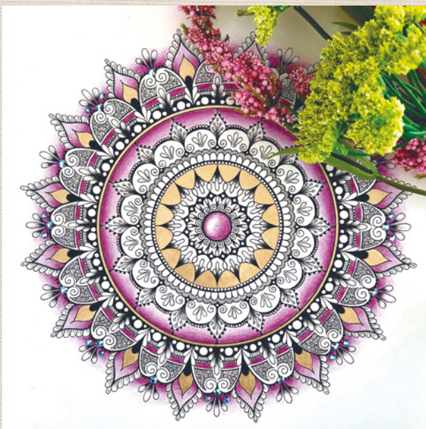
Autor: Kateřina Vančurová – @kathree_art

Ne každý člověk je schopný vytvořit okolo sebe řád a harmonii, ale většina lidí se v prostoru, kde takový řád a harmonie jsou, cítí hezky. Proto si trůfám tvrdit, že pohled na mandalu vyvolává v člověku něco příjemného. Ať už je tvořena z čehokoliv, její seskupení na nás působí pozitivně. Velmi důležité jsou také její barvy. Podobně jako si každý oblíbí jiný druh hudby, protože s ním právě tento žánr nějakým způsobem rezonuje, tak někde tam uvnitř nás existuje něco, co nám třídí barvy na oblíbené, méně oblíbené nebo dokonce nelibé. A zmiňuji to právě proto, že když člověk spatří takovýto harmonický celek v podobě mandaly, který navíc nese jeho oblíbené barvy – zastaví se. Jako by jeho duše volala: „Prosím počkej, jen chvíli postůj a dívej se, načerpám si trochu energie...“