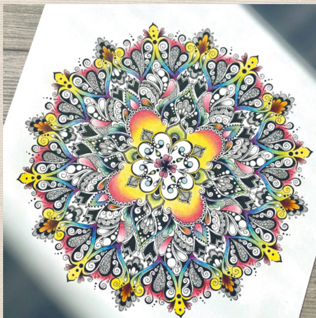
Autor: Kateřina Vančurová – @kathree_art