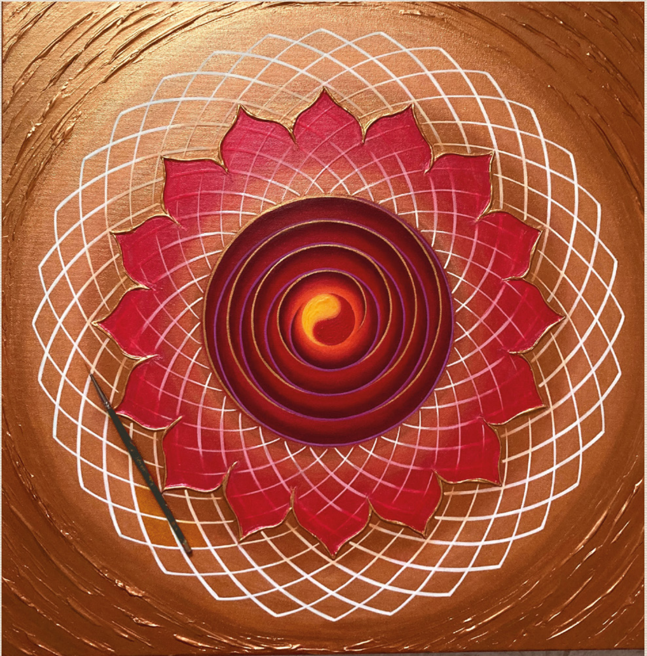
Autor: Jessie Su Chenchiao - @jessie_painting_brush