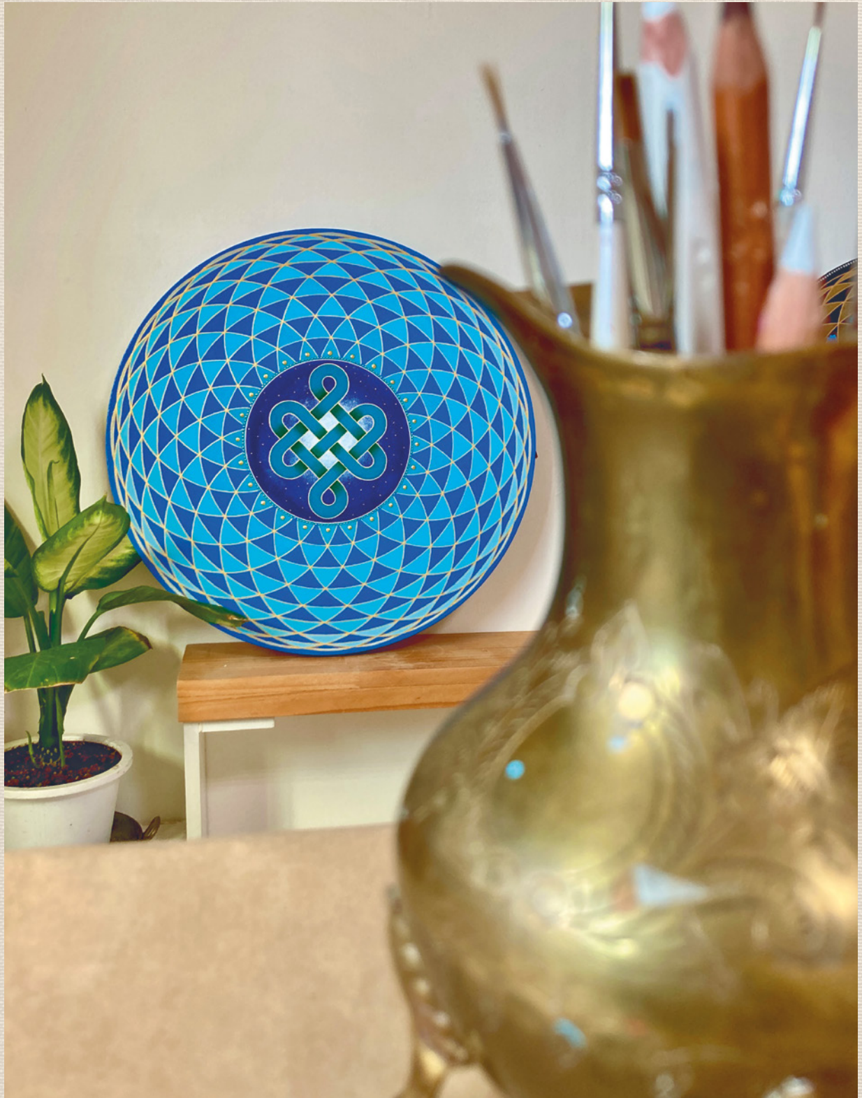
Autor: Jessie Su Chenchiao - @jessie_painting_brush