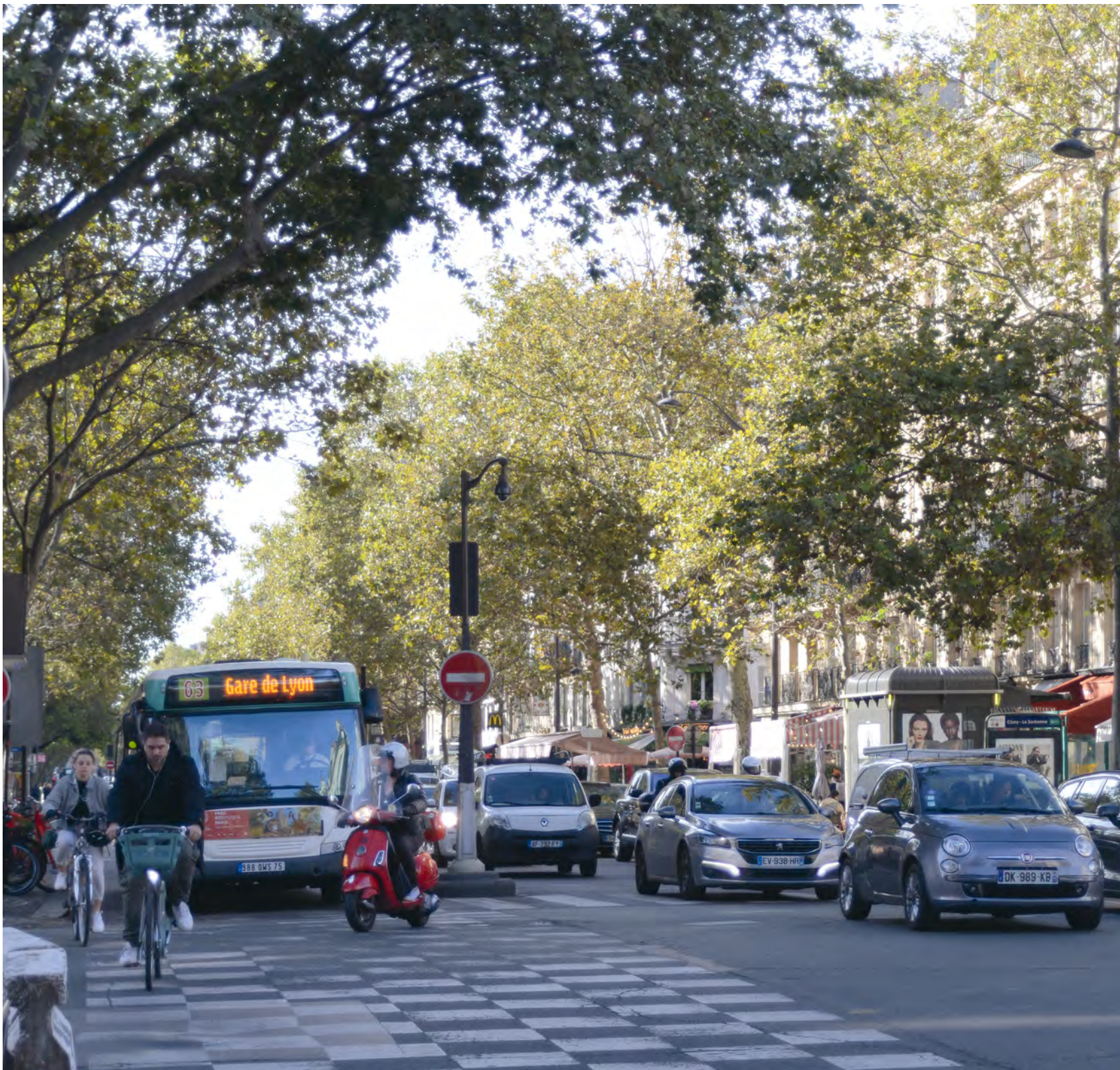
Hlavní ulice jako cesta městem (boulevard Saint-Germain, Paříž)