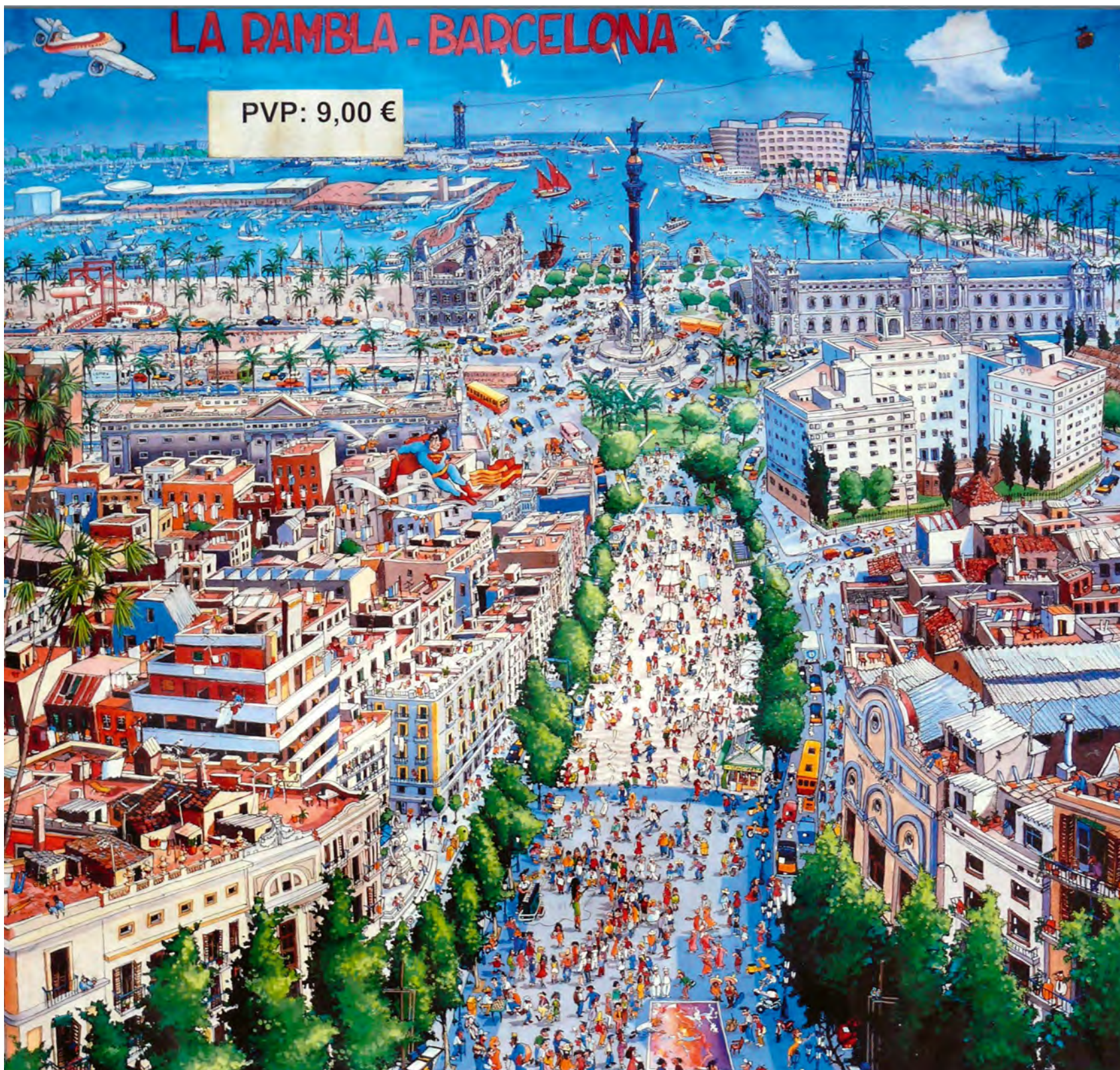
Hlavní ulice jako fenomén budující obraz města (La Rambla, Barcelona)