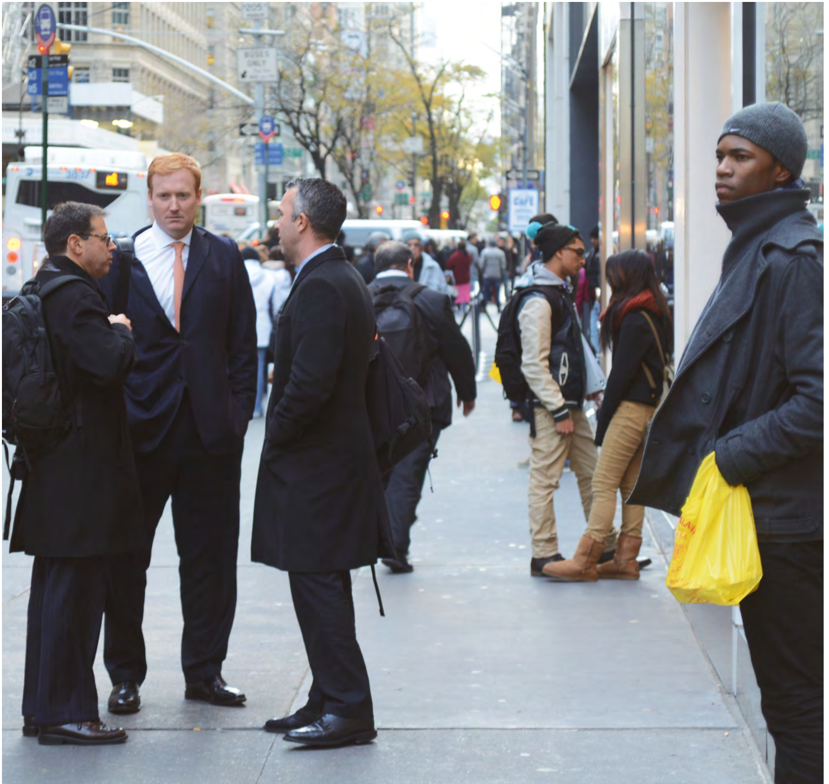
Hlavní ulice jako místo lidské interakce (Fifth Avenue, New York)