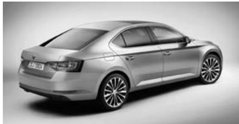
▲ Škoda Superb třetí novodobé generace debutovala v únoru 2015

Koncem dubna 2015, právě když v Kvasinách přebíral vládu zbrusu nový Superb III, automobilka oznámila, že úhrnná výroba automobilů Superb dosáhla od roku 2001 čísla 750 tisíc, včetně necelých sedmi stovek exemplářů třetí generace.