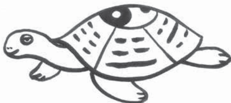
Obr. 1 Želva

Vývoj čínských bojových umění překlenuje dobu tří tisíciletí. Prvopočátky boje a rozvoj bojových technik lze vysledovat již v dobách před naším letopočtem z vyobrazení rituálních bojových tanců na kostech a želvích krunýřích.