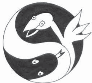
Obr. 2 Had a jeřáb

Snad žádné jiné bojové umění není opředeno tolika fascinujícími legendami a příběhy. Jedna ze známých zkazek připisuje vznik Tai chi taoistickému filozofovi Zhang San-fengovi ze 13. století, který k shaolinským bojovým myšlenkám dodal myšlenky taoismu. Traduje se, že Zhang San-feng spatřil boj hada a bílého jeřába, inspiroval se jejich kruhovými pohyby a objevil tak Princip Tai chi, který si později podrobně vysvětlíme. Legendy označují tohoto filozofa za nesmrtelného a na důkaz jeho nesmrtelnosti zasazují jeho život hned do několika staletí.