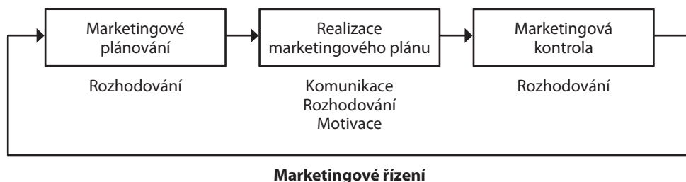
Obr. 1.1 Proces marketingového řízení

Co se vlastně míní pojmem marketingové řízení? Marketingové řízení je proces zahrnující plánování, realizaci a kontrolu v marketingu, jak znázorňuje následující obrázek.