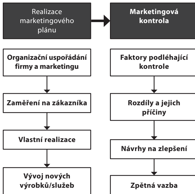
Obr. 2.2 Proces realizace a kontroly v marketingu

Po naplánování následují další aktivity marketingového řízení. Následující obrázek znázorňuje realizační a kontrolní proces ve firmě s hlavními aktivitami. Důležitou součástí marketingového řízení je také vývoj nových výrobků či služeb .