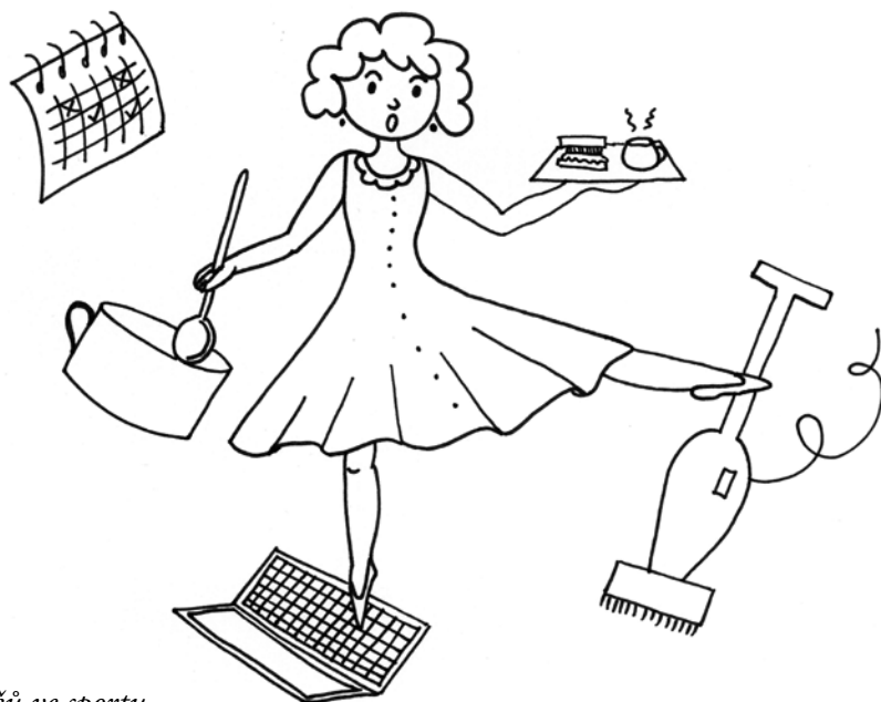
Role rodičů ve sportu

Pak začínáme nevědomky žít život dítěte, přebírat za něj zodpovědnost, očekávat, že ta „rodičovská časová investice“ přece má nějaký smysl a dítě u sportu zůstane. Přestáváme „dobíjet“ baterky u aktivit, které máme rádi, protože na ně najednou nemáme čas. To se projeví negativně na náladě a komunikaci a samozřejmě i na psychické pohodě dítěte. Jednou za čas je proto rozumné zamyslet se nad svým osobním životem a energetickou rezervou.