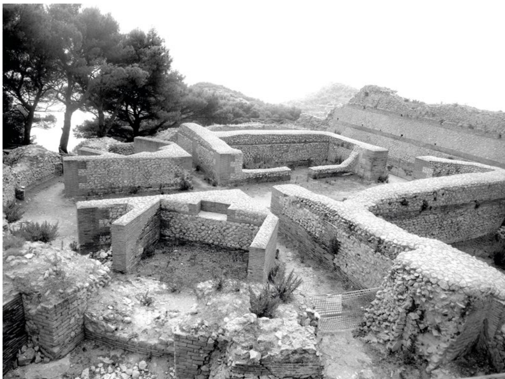
1 Ruiny letního sídla císaře Tiberia na ostrově Capri