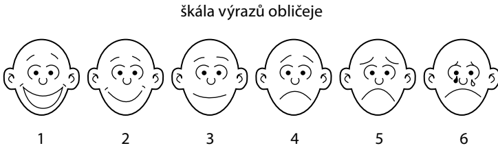
Obr. 2 Vizuální škála bolesti