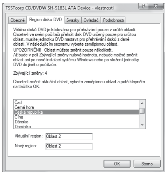
Obrázek 1.3: Vlastnosti vypalovací mechaniky – region

Následně se otevře okno Správce zařízení , které je na obrázku 1.2. V okně správce zařízení rozbalte seznam Jednotky DVD/CD-ROM . Zde by měla být vaše vypalovací mechanika, v případě, že máte mechanik více, jsou zde vypsány všechny. Pro zjištění informace o dané