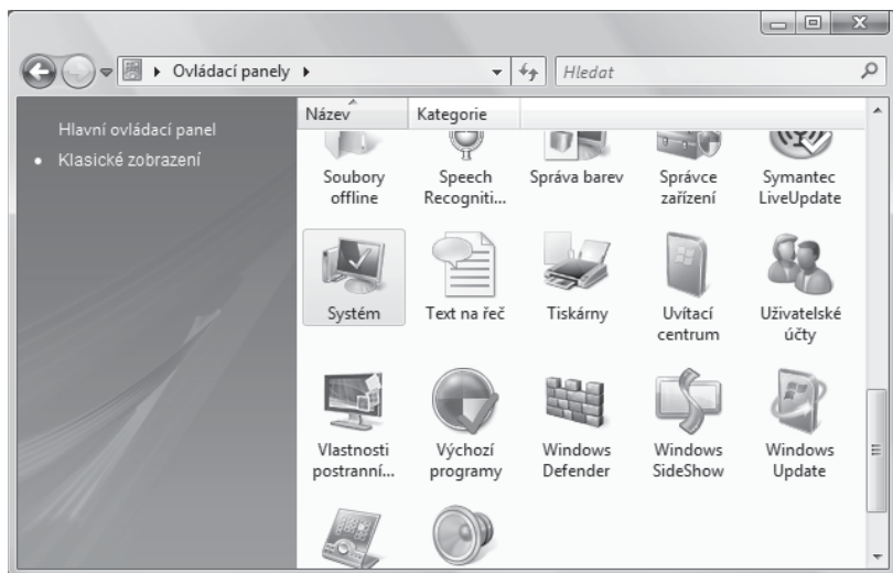
Obrázek 1.1: Ovládací panely ve Windows Vista

Region mechaniky je uložen přímo v mechanice a nikoliv v operačním systému. Jakmile tedy dosáhne množství povolených změn nulové hodnoty, již není možné region změnit a to ani tehdy, vložíte-li mechaniku do jiného počítače.