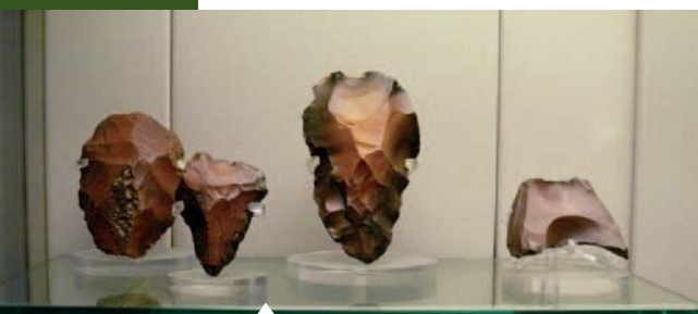
Obr. 1: Pazourkové pěstní klíny (expoze British National Museum, Londýn).

oštěp, prak a bumerang (málo známou skutečností je, že tato na svoji dobu účinná zbraň byla hojně používána i na evropském území). K nim se postupně přidávají další vynálezy, kterými byly dokonalé pazourkové a kostěné hroty, harpuny a vábničky (obr. 2). V historii lovu zvěře se velmi záhy uplatňují i dva nejpřevratnější objevy lidské historie – umění rozdělávat oheň a používat luk a šíp. Teprve tato zbraň konečně umožnila lovit