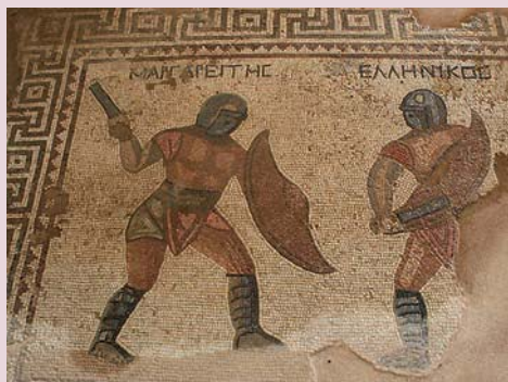
Mozaika z římského období – House of Gladiators.

Rozkvět mozaiky přišel ve 4. století př. n. l., kdy se začaly objevovat figurální motivy, které byly ozdobou přepychových paláců mocných řecko-makedonských dynastií. Mozaika se také začala používat k zvýraznění malovaných obrazů a to tak, že se původní malba vyskládala barevnými skleněnými mozaikovými kameny, které začaly nahrazovat kameny přírodní.