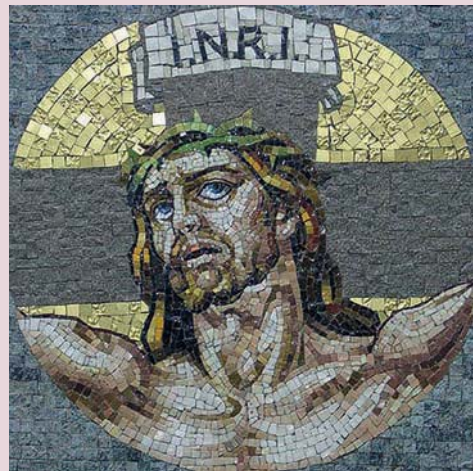
Dílo ze známé dílny „Le pietre nell'Arte“, kterou založil Renzo Scarpelli v roce 1972 ve Florencii

Pro úplnost je nutné zmínit se o známé florentské mozaice, která vznikla ve Florencii v 16. století a vytváří se tam dodnes. Jednotlivé přesně nařezané a zabroušené mozaikové kameny, se sesazují k sobě tak těsně, že spáry jsou skoro neviditelné a nespárují se. Tím se florentská mozaika liší od mozaik ostatních, které mají širší spáry vyplněné spárovací hmotou. Celý povrch florentské mozaiky se na závěr zbrousí do roviny a vyleští.