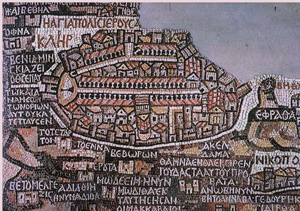
Madabská mapa, je část podlahové mozaiky v byzantském kostele sv. Jiří v Madabě, v dnešním Jordánsku. Je datována do 6. století. Původně měřila 21 x 7 m a skládala se z více než dvou milionů kaménků