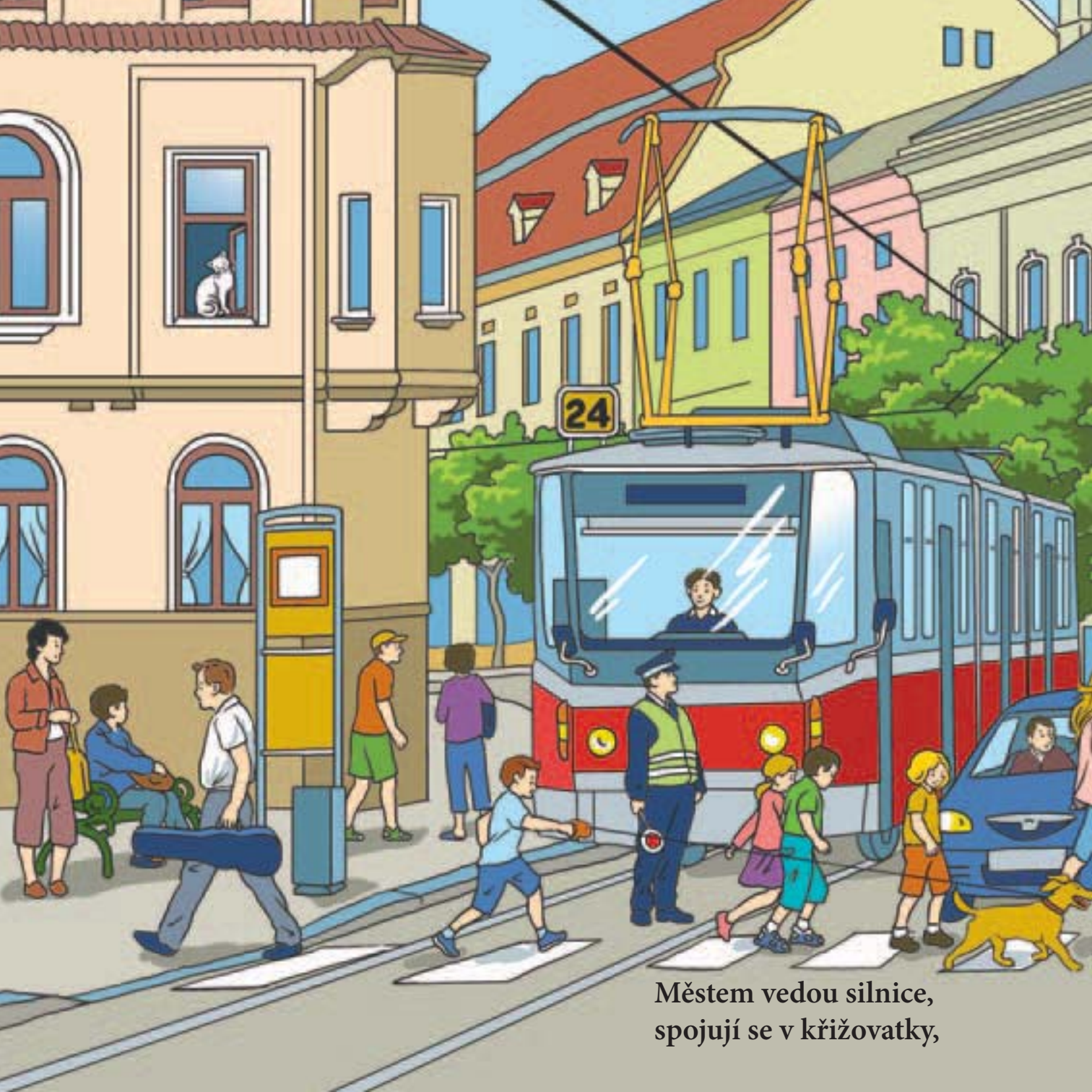
Městem vedou silnice, spojují se v křižovatky,