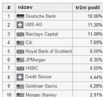
Tabulka 1.1 10 největších forexových obchodníků