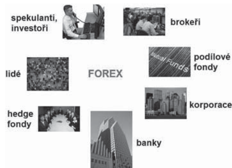
Obrázek 1.1 Účastníci trhu

Forex je největší burzou na světě, která je otevřena 24 hodin denně a věnuje se jí každý den přes 15 milionů účastníků. Patří mezi ně instituce, profesionální obchodníci včetně těch začínajících (viz obrázek 1.1). Na Forexu jako na každé jiné burze platí, že najednou nemohou všichni vydělávat. Buď vydělává jeden a druhý prodělává, nebo naopak.