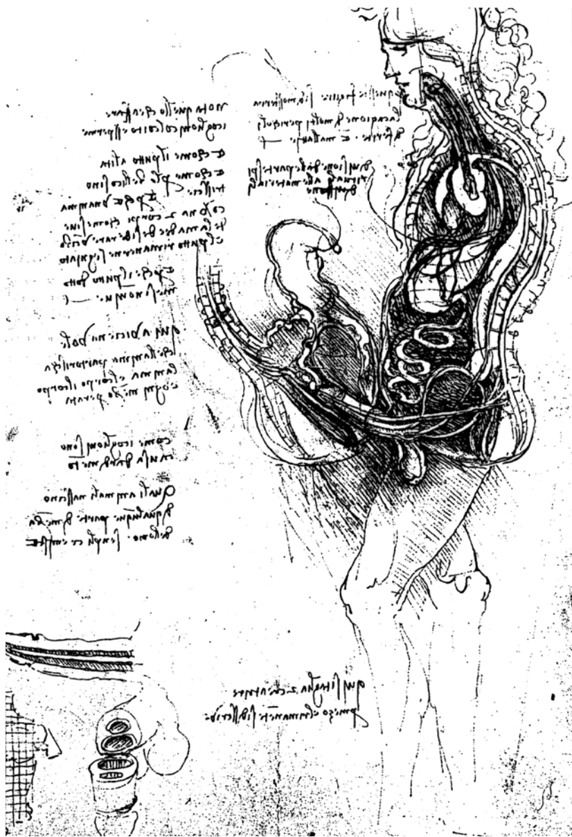
Leonardo da Vinci: Anatomická kresba koitu