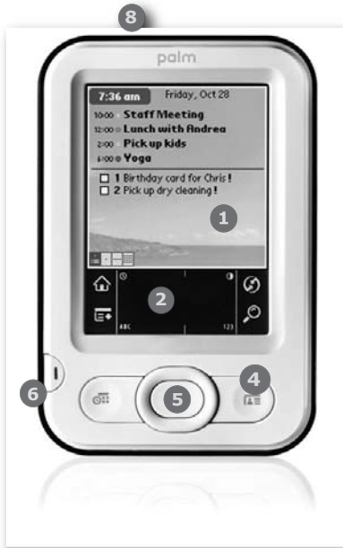
Obrázek 1.2: Palm Z22