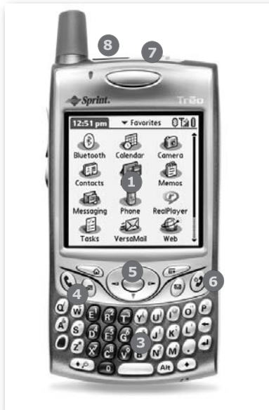
Obrázek 1.3: Smartphoner Treo 650