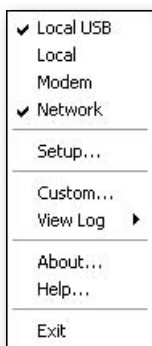
Obrázek 2.1: HotSync Manager

Volba Setup je nastavení, z něhož je v současné době důležitá jen položka General a Network . V první se nastavuje dostupnost HotSync Manageru . Chce-te-li se vyhnout problémům, nastavte ji na Always available . HotSync Manager se tak spustí při startu počítače. V záložce Network můžete zaškrtnutím povolit synchronizaci přes síť pro jednotlivé uživatele.