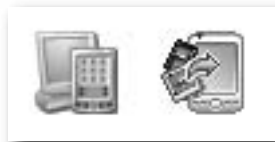
Obrázek 1.4: Ikony programů Palm Desktop a Quick Install

Druhým důležitým programem je Quick-Install , jehož úkolem je instalovat nové programy a další data na Palm. Podíváme se na něj v následující kapitole v rámci podrobného popisu instalace dodatečného programu na Palm, kterou si předvedeme na instalaci české lokalizace (prostředí systému).