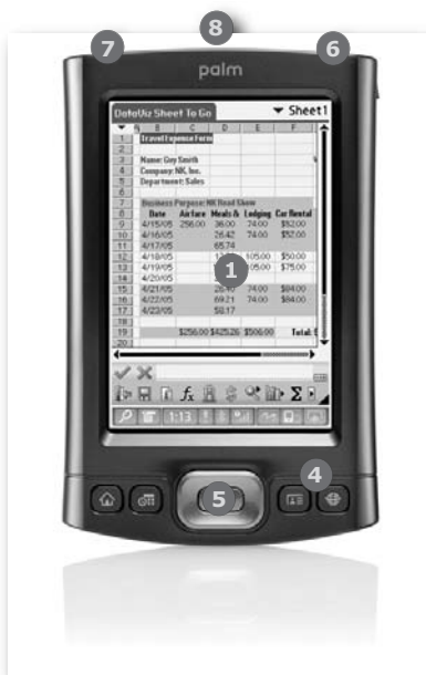
Obrázek 1.1: Palm |TX

V průběhu nabíjení se můžeme seznámit s hardwarem a ovládacími prvky kapesního počítače. Vzhled různých modelů kapesních počítačů se liší, základní prvky