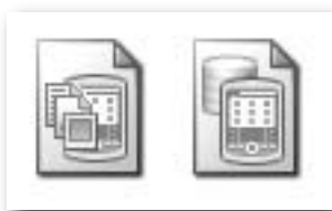
Obrázek 2.2: Ikony souborů typu PRC a PDB