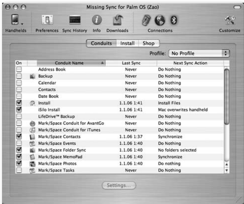
Obrázek 1.5: Missing Sync pro Palm na počítači s Mac OS X Tiger

mu, synchronizuje fotky z iPhoto , hudbu z iTunes , změny ve vybraných složkách na Macu a Palmu a dokáže i sdílet internetové připojení do Palmu, nebo připojit paměťovou kartu jako disk k Macu. Missing Sync synchronizuje PIM aplikace bez nedostatků, kterými trpí iSync a do použití Palmu a Macu přináší zcela nový komfort.