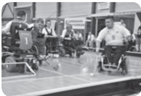
Florbal na elektrických vozících

zkratka pro mezinárodní federaci florbalu na elektrických vozících (electric wheelchair hockey). Používají se speciálně upravené vozíky s pohonem, jejichž cena se pohybuje okolo 200 tisíc Kč. Sedící hráči ovládají jednou rukou páčku k pohybu vozíku, zápěstí a předloktí druhé ruky mají pevně přivázané k hokejce. Více postižení mají před stupačkou tzv. T-stick, kterým vodí míček. Branky i mantinely jsou snižené.