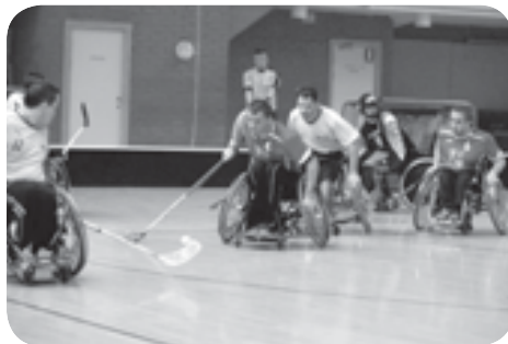
Florbal vozíčkářů

zíčkáři mají zvláštní dodatky k pravidlům, upravující například střídání, zakazující hraní hokejkou pod vozíkem či nad úrovní velkých kol vozíku atd.