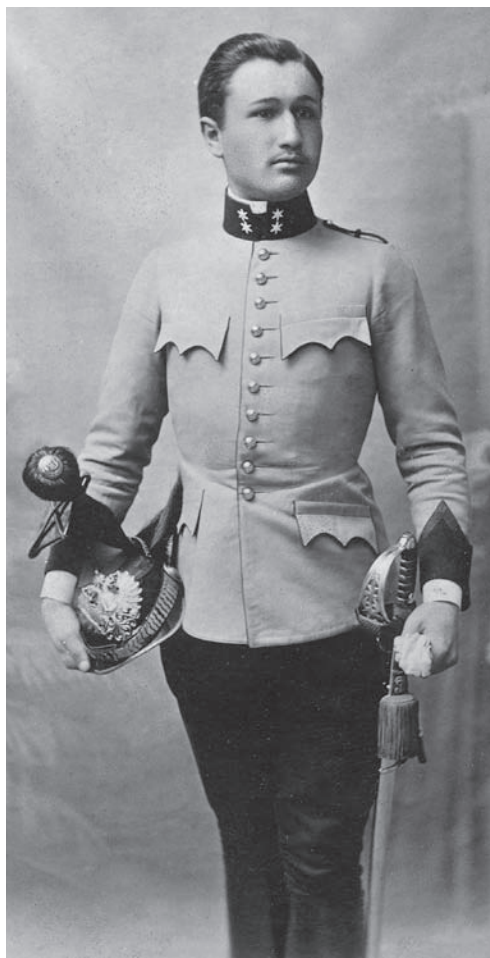
Nejmladší dragounský poručík v rakouské armádě. Nedatováno.