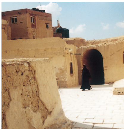
Hlínění omítky koptského klášteřa v Egyptě

Jíl jako pojivo a hlína jako hotový materiál byly nepochybně první hmotou použitou ke stavbě a k následní povrchové úpravě. Jílové mazaniny ( obr. 2 ) můžeme považovat za nejstarší typy omítek. Jíl je složka zeminy tvořená jílovými minerály s maximální zrnitostí 0,002 mm. Je tedy již přímo součástí hlíny a praktickým požadavkem