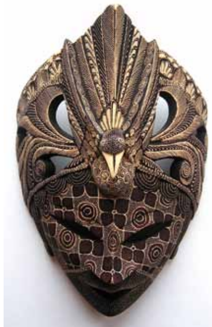
Batika na dřevě, Topeng – maska, umělecký suvenýr inspirovaný tradičními rituálními maskami

Batikování je velmi náročný a zdoluhavý proces, který vyžaduje velkou zručnost. Samotné slovo batik vzniklo složeninou javánských slov amba = psát a titik = tečka. Nejvíce ceněný je tzv. Batik Tulis ( tulis = psát), ručně malovaný batik , při kterém se vosk na látku nanáší pomocí nástroje canting (čti čanting), měděné nádoby s bambusovou rukojetí. Do této speciální nádoby se nabírá roztavený vosk, který trubičkou vytéká ven. S pomocí tohoto nástroje je možné na podklad doslova psát a vytvářet tak neuvěřitelně jemné vzory.