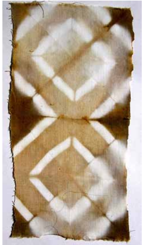
Skládaná batik, tzv. tie dye, barveno přírodními barvivy

Batikování je tradiční javánská technika, která byla 2. října 2009 prohlášena organizací UNESCO národním nemotným kulturním dědictvím Indonésie.