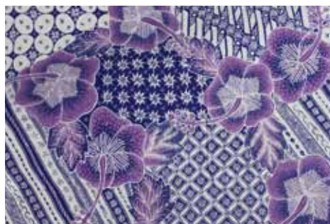
Příklad mísení vzorů z jednotlivých regionů