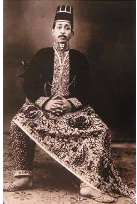
Člen javánské královské rodiny v batikovém oděvu (zdroj: ROOJEN, P., Batik Design , Amsterdam, The Pepin Press, 1993)