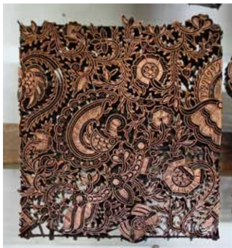
Batikovací razítka jsou sama o sobě uměleckým dílem

V polovině 19. století se v souvislosti se zvyšující poptávkou po batikových látkách a oděvech velmi rychle rozšířila nová technika batikování pomocí měděného razítka, která podstatně zrychlila výrobu a zpřístupnila batik širším vrstvám obyvatelstva. Samotné batikovací razítko je malým uměleckým dílem, které si můžete na Jávě pořídit jako suvenýr na každém větším trhu.