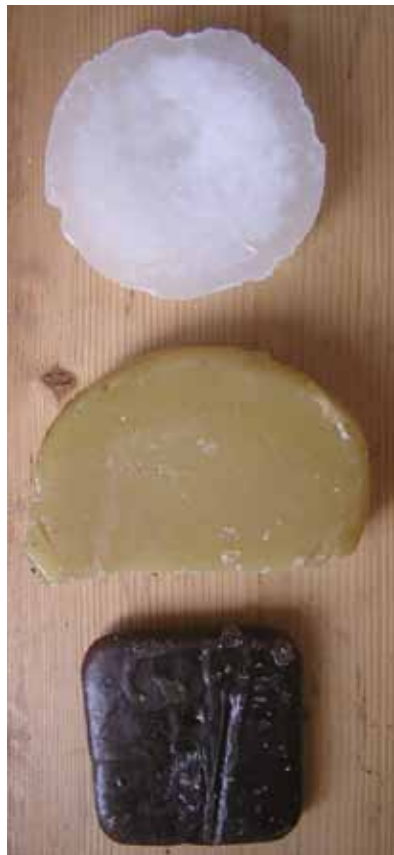
Na Jávě se používají tři druhy vosku, parafín, lilin a lilin cokelat. Parafín je k dostání i u nás, lilin nahradíme včelím voskem

Vosk na látce působí jako tzv. rezerva, to znamená, že místa, která jsou natřená voskem, nepropouští barvu. Po dokončení barvicího procesu se vosk z podkladu, kterým může být nejen textil, ale též dřevo, odstraní.