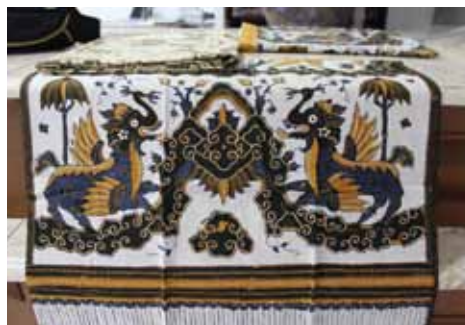
Tradiční motiv – Batik Cirebon