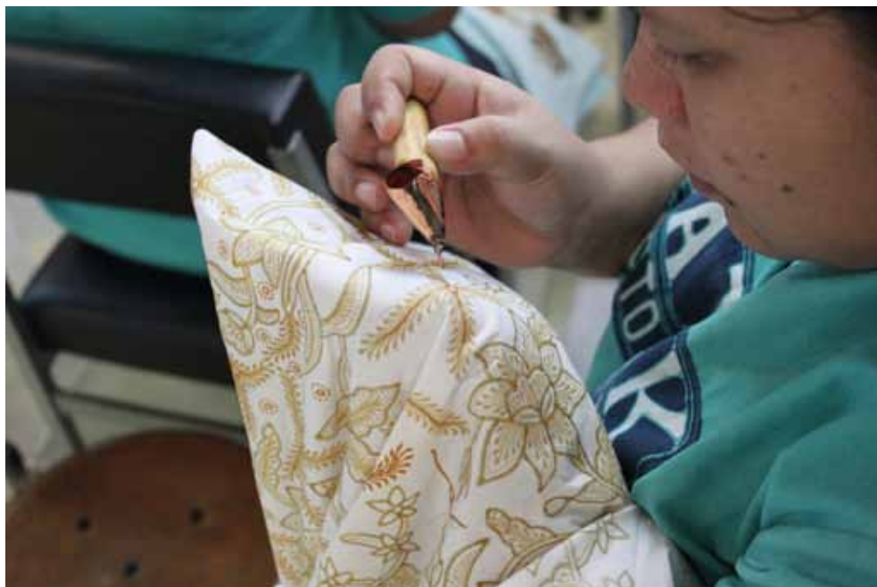
Práce s cantingem

Batikování je velmi náročný a zdoluhavý proces, který vyžaduje velkou zručnost. Samotné slovo batik vzniklo složeninou javánských slov amba = psát a titik = tečka. Nejvíce ceněný je tzv. Batik Tulis ( tulis = psát), ručně malovaný batik , při kterém se vosk na látku nanáší pomocí nástroje canting (čti čanting), měděné nádoby s bambusovou rukojetí. Do této speciální nádoby se nabírá roztavený vosk, který trubičkou vytéká ven. S pomocí tohoto nástroje je možné na podklad doslova psát a vytvářet tak neuvěřitelně jemné vzory.