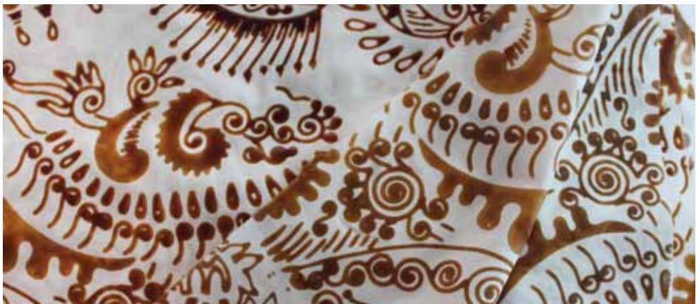
Vosková rezerva nanesená na plátno pomocí měděného razítka