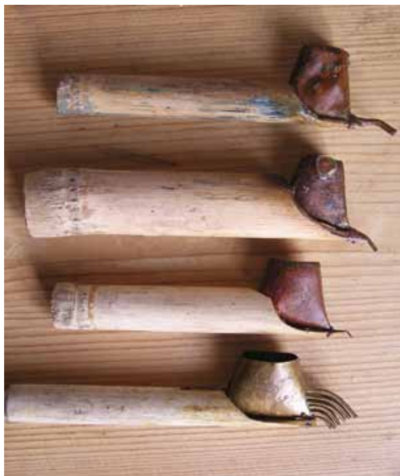
Cantingy mají různé průměry i počet trubiček, kterými vytéká vosk ven

Canting je tradiční nástroj na ručně malovanou batik, tzv. Batik Tulis , používaný na Jávě, ale i jinde ve světě. Javánské cantigy však patří mezi nejlepší. Jedná se o měděnou nádobku s bambusovou nebo dřevěnou rukojetí a s malou trubičkou, kudy vytéká roztavený vosk ven. Cantingem na látku do slova malujeme, nebo přesněji řečeno – píšeme ( Batik Tulis , indonéské slovo tulis = psát). Trubičky mají různé průměry, a proto s nimi můžeme vykoulit jemné linie a tečky, ale také pokrývat i velké plochy voskem. Vše závisí na tom, jaký průměr trubičky zvolíme. Materiál, ze kterého je canting vyrobený má velmi dobré tepelné izolační vlastnosti a vosk, který do cantingu nabereme, v něm vydrží relativně dlouho horký.