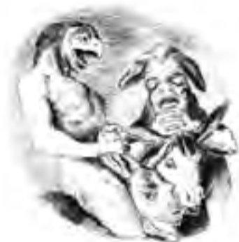
Kresba maskovaných postav od Francisca Goyi podle grafického listu Los Caprichos, 1799