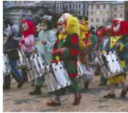
Karnevalový průvod v Bazileji, 2002

Masky nás mohou stále fascinovat nejen jako doklad dávných magicko-kulturních významů, ale také jako etnicko-náboženské a výtvarně-dramatické objekty. Přestože v mnoha případech masky ztratily své původní významy, mnohdy i uměleckou kvalitu, stále nabízí intenzivní zážitky spojené s proměnou vzhledu, nespočtem rolí a identit.