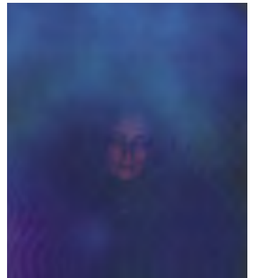
Aura je odrazem mentálního, duchovního a emočního stavu. Jako projev koherentního záření ji lze zachytit na speciálním fotografickém přístroji v spektrálním pásmu 390 – 790 nanometrů