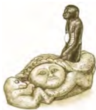
Inuitská mytická bohyně moře Nuliayuk – Sedna