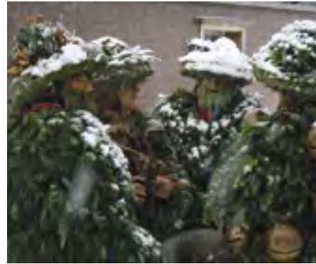
Ve švýcarském městečku Urnäsch se každoročně pořádají prosperitní maskované občůzky