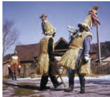
Slaměné maškary se zdobenými homolovitými klobouky a nalíčenou tváří, Chrudimsko, 1983