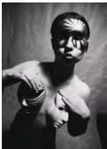
Figurální kompozice z cyklu Masky, Jan Parkman, 2002