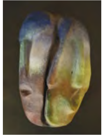
Alter ego, práce autorky, kaširovaná maska, tempera, vosková patina, rozměry 30 × 18 cm, 2002

Kniha Maska v proměnách času a kultur je rozdělena do tří celků, první se věnuje charakterizaci masek, vztahům mezi maskou, jejím nositelem a divákem a zabývá se také různými funkcemi a použitím masek. Druhá část je věnována maskám z pěti kontinentů, v jednotlivých kapitolách jsou stručně charakterizované masky z různých kulturních regionů. Je zapotřebí si uvědomit, že přestože se v současnosti s maskami setkáváme spíše v muzeích a galeriích, tvořily a mnohde dosud tvoří součást živé kultury. Třetí část je věnována materiálům a výrobním postupům při tvorbě masky. Rozsah knihy neumožnil zpracovat všechna témata, která se tohoto fascinujícího multikulturního fenoménu týkají. Pokud kniha vyvolá u čtenářů hlubší zájem o masky, případně je bude inspirovat k výtvarné tvorbě, aktivní účasti na masopustu nebo jiné maskované události, budu mít pocit, že moje práce splnila zamýšlený účel.