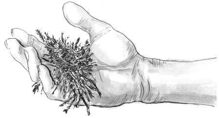
Obr. 3 Materiál je příliš suchý

Orientační zkouška v praxi zcela postačí!