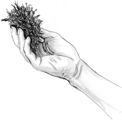
Obr. 2 Optimální vlhkost materiálu

Když je materiál příliš vlhký, objeví se při zmáčknutí voda mezi prsty; pokud lze vymáčknout více než jednu kapku vody, je materiál již příliš vlhký (obr. 4).