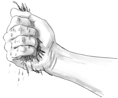
Obr. 4 Materiál je příliš vlhký